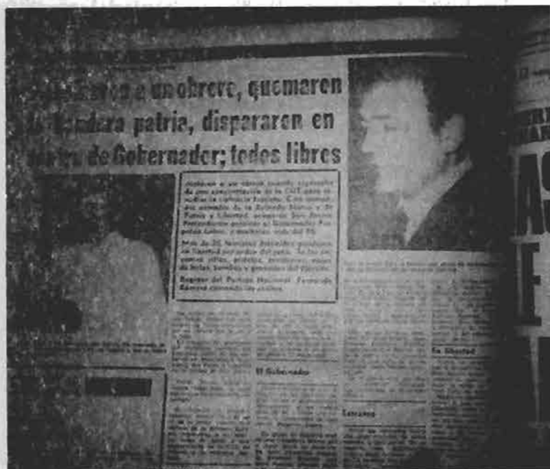
Titulares de Puro Chile , 29-09-1972: asesinato de un campesino en Linares.