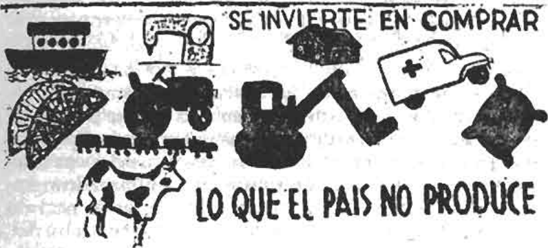
Propaganda mural señalando las deficiencias de la economía chilena. En New Chile , p.139.

Esta cita ilustra un problema importante: el de saber definir las prioridades en el momento de decidir con cuáles medios se iba a responder a las expectativas sociales analizadas en la sección anterior, y que probablemente constituían las aspiraciones de la mayoría. Las nacionalizaciones podían constituir un paso importante, pero al mismo tiempo había que preocuparse por el rendimiento de las nuevas empresas. Así, para este mismo testigo, cuando se debía llegar a definir lo que era socialismo, esa preocupación seguía dominando sus ideas: "era algo un poco nebuloso... tal vez que hubiera una zona de economía estatal importante, que el país comenzara a crecer, a desarrollarse, a crear mucha riqueza para toda la gente...".