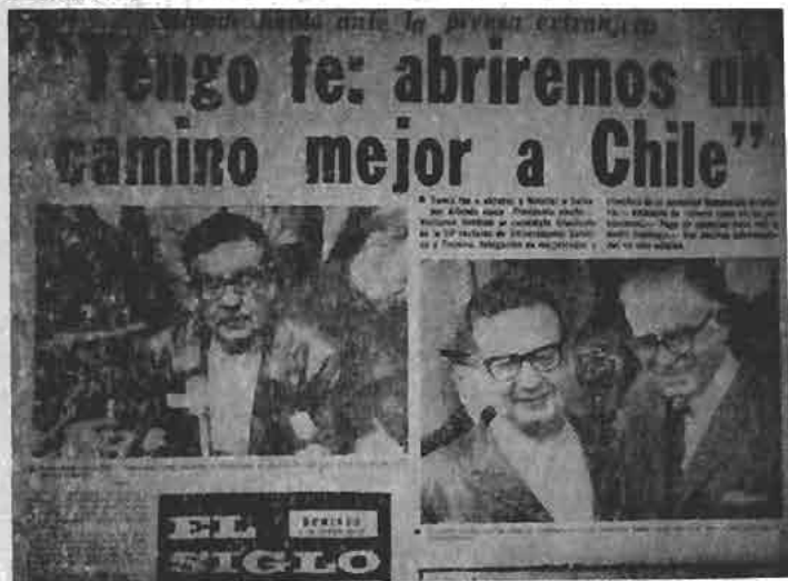
Titular de El Siglo del 6-09-1970, dos días después del triunfo de Allende. A la derecha: Allende recibe el apoyo de Radomiro Tomic.

yor justicia social. Tales perspectivas no eran apoyadas solamente por aquellos que habían votado por Allende. Un sector importante —quizás mayoritario— de los partidarios del candidato de la DC, Radomiro Tomic, parecía favorable al nuevo gobierno. Además, la opinión pública internacional veía con simpatía la experiencia chilena de “transición pacífica hacia el socialismo”.