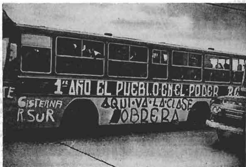
El optimismo de la izquierda durante el primer año de gobierno. En New Chile .