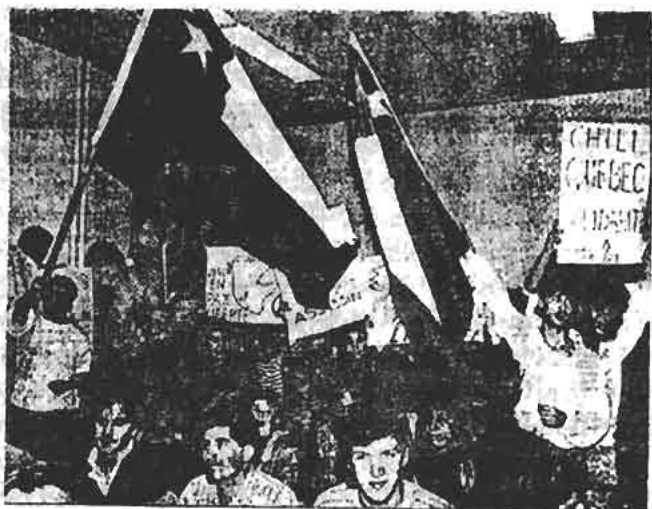
Chilenos de Montreal celebrando la victoria del "No" en el plebiscito del 5 de octubre de 1988.