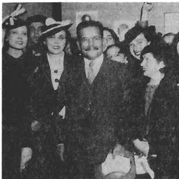
Pedro Aguirre Cerda, candidato triunfante del Frente Popular en 1938.