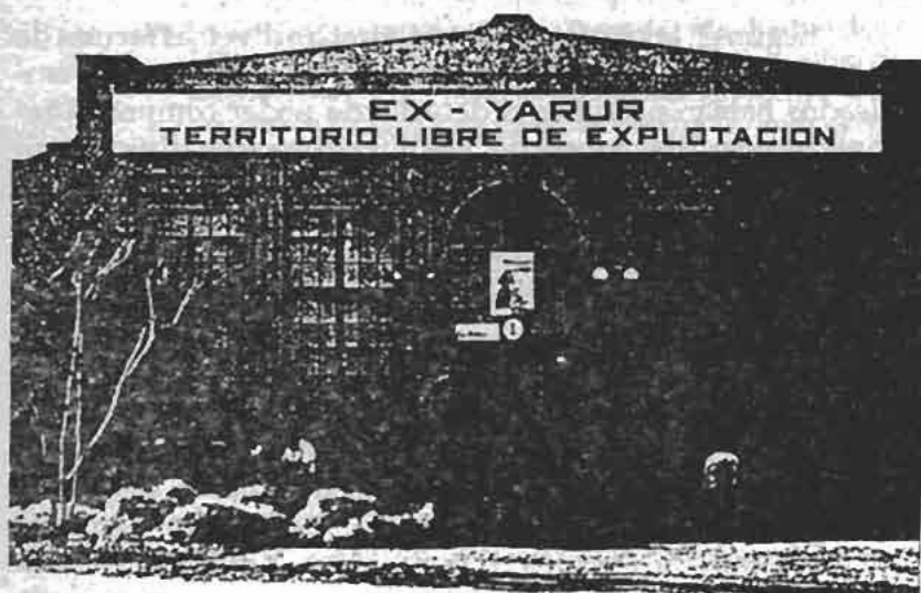
Imagen de Yarur al pasar al Area de Propiedad Social.