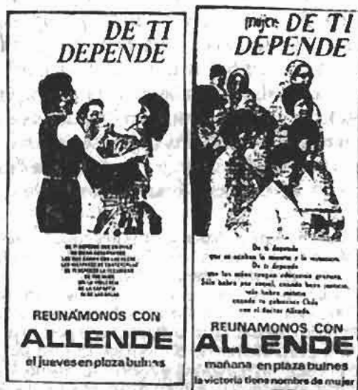
Publicidad de la izquierda hacia la mujer durante la campaña electoral de 1970. El Siglo , 26 y 27-07-1970.