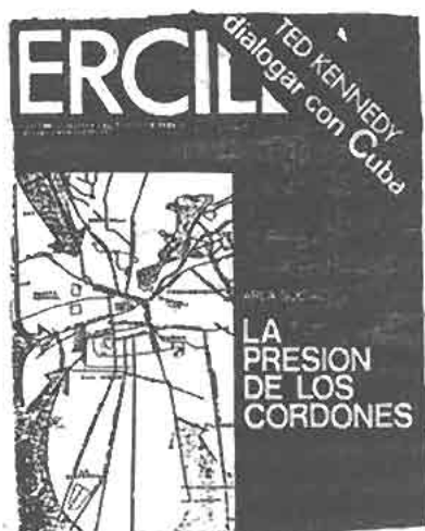
Imagen amenazadora de los cordones en la portada de la revista Ercilla N° 1960 del 7 al 13-02-1973.

“No creo que exista una sola persona que haya trabajado en los cordones que diga lo contrario de lo que yo digo, fue una escuela increíble, rica, que sólo el tiempo va a reconocer como una de las experiencias más extraordinarias que han ocurrido... Fue también una lección para muchos funcionarios burócratas, incluso para el PC, que tuvo que salir con la cola entre las piernas en muchas oportunidades... [En los cordones] la participación fue realmente espontánea, con la presencia de otra gente que no era del gobierno de la UP, como el MIR, el FTR y los trotskistas, a los que no se les podía prohibir participar”.