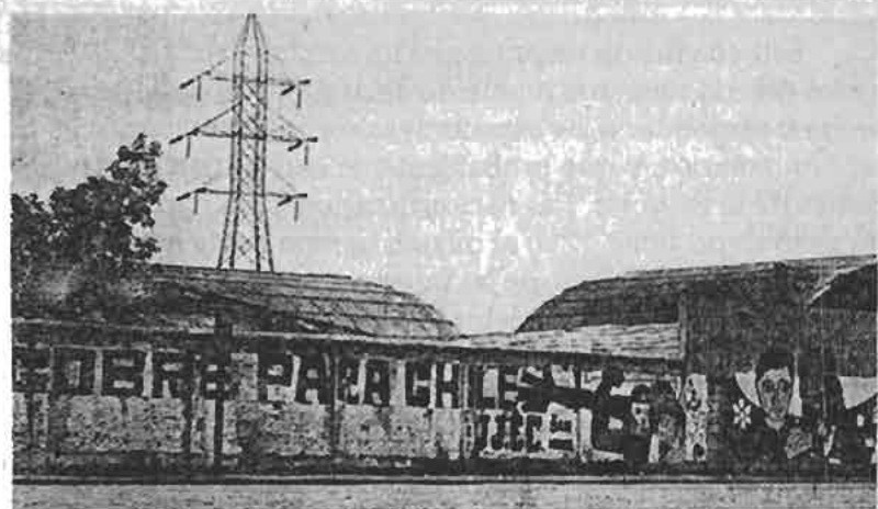
Propaganda mural pintado por la Juventud comunista en favor de la nacionalización del cobre. Barrio de San Miguel, sur de Santiago. En New Chile , p.95.