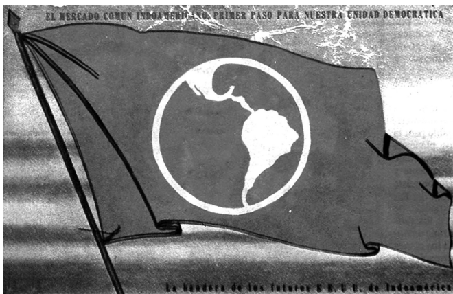
Bandera aprista.