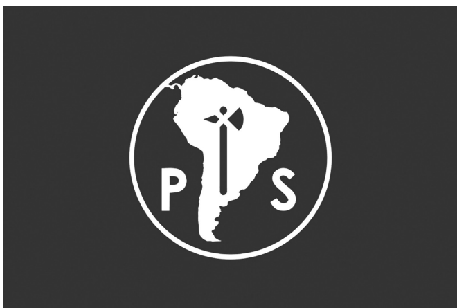
Bandera del Partido Socialista de Chile.