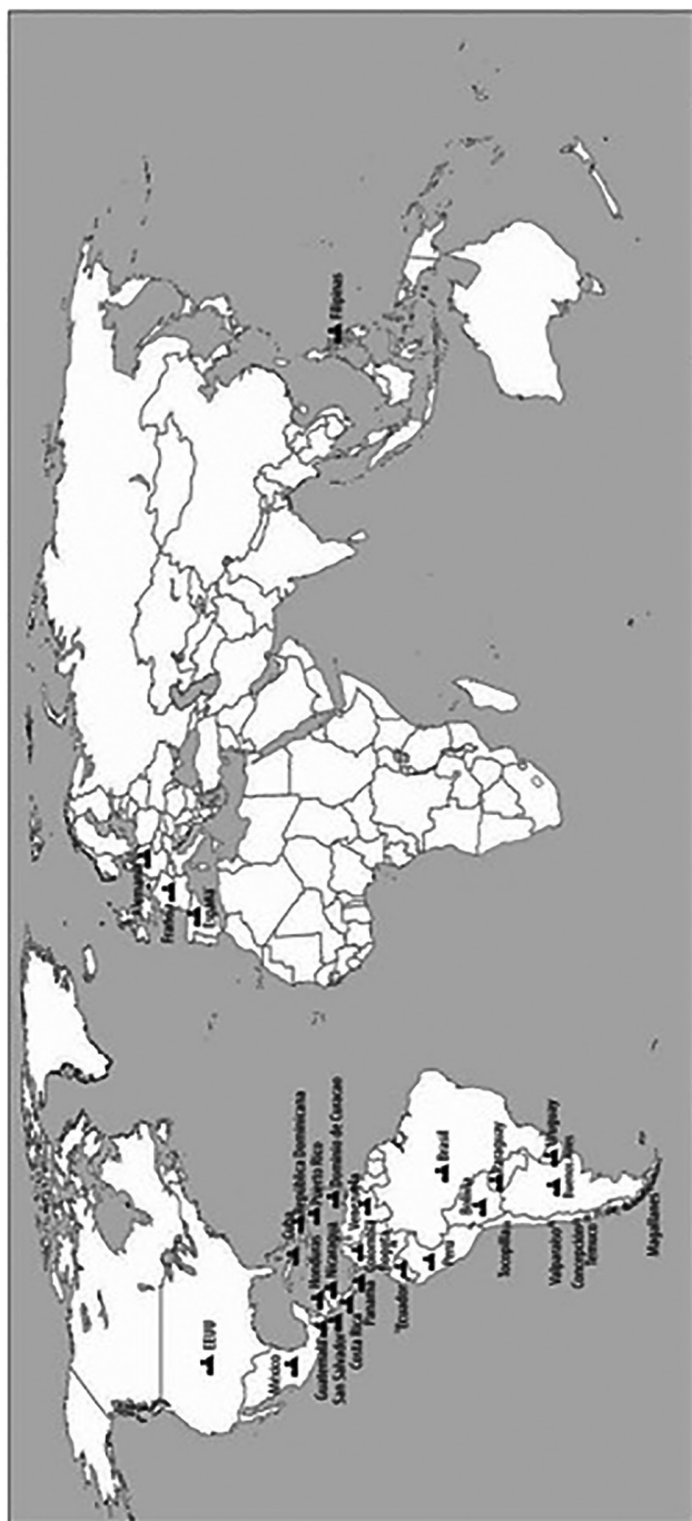
Mapa n.º 2 OFICINAS Y REPRESENTANTES DE LA EDITORIAL ERCILLA (1938)

Información en revista Hoy , n.º 247, Santiago, 13 de agosto de 1936, p. 14; n.º 253, 24 de septiembre de 1936, pp. 27-28; n.º 123, 12 de septiembre de 1937, p. 21; n.º 410, 28 de septiembre de 1939, pp. 28-29.