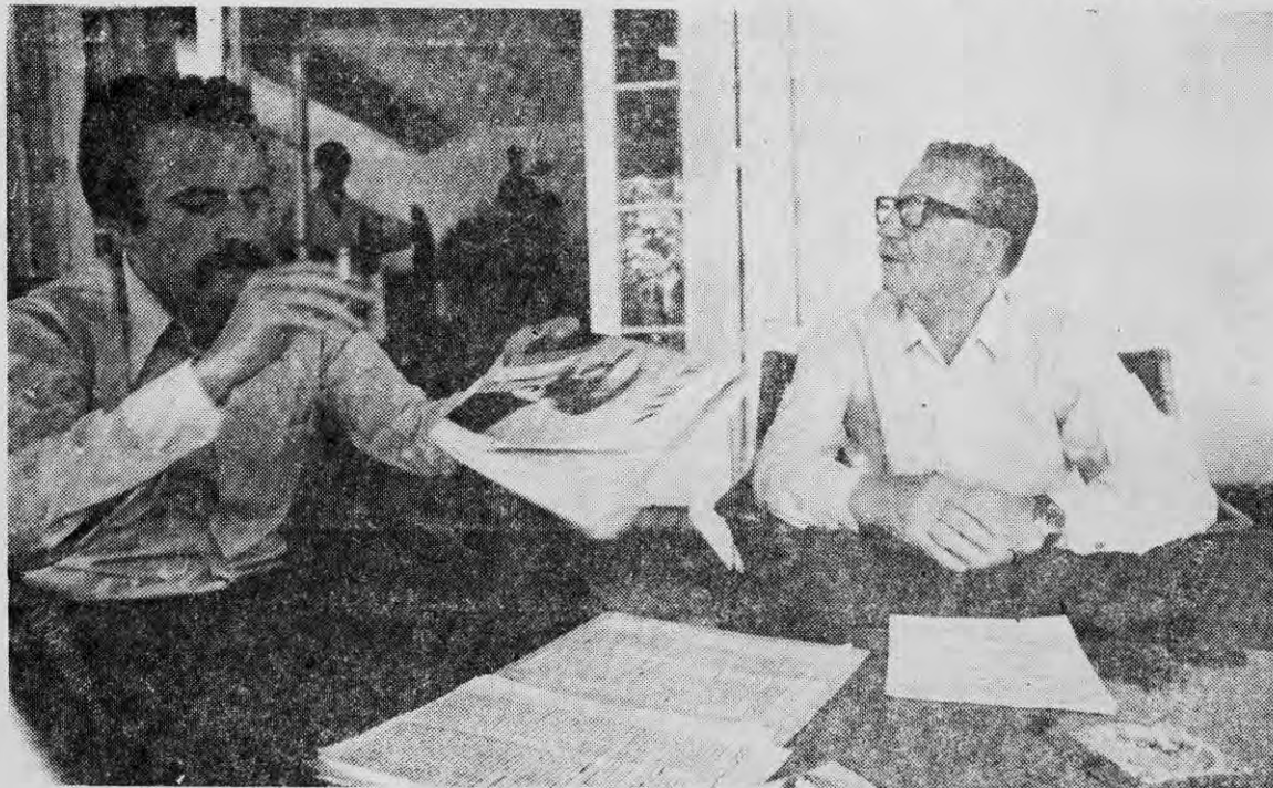
EL PRESIDENTE ALLENDE CONVERSA CON REGIS DEBRAY

DEBRAY: Compañero Presidente: ¿cambia un hombre cuando está en el poder?