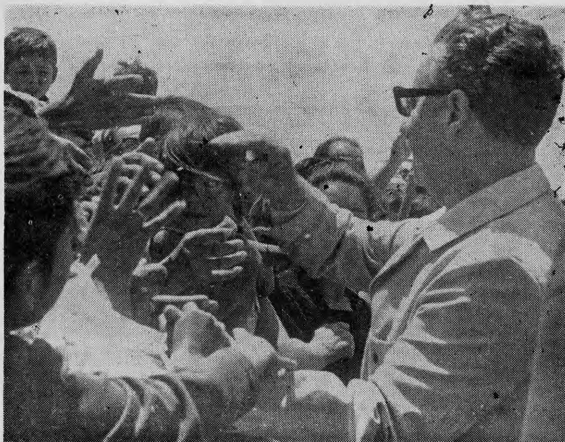
ALLENDE: depositario de la fe del pueblo.

munista, sin embargo, fue puesto fuera de la ley durante períodos prolongados (1925-1935, 1948-1958), bajo Alessandri y luego con González Videla, y el sindicalismo independiente fue golpeado más de una vez pero incluso en las fases de clandestinidad y persecución, las organizaciones obreras lograron subsistir, mantenerse en pie y ganar terreno, a través por ejemplo del Partido Socialista que siguió legalizado o con ayuda de la pequeña burguesía liberal (cuyos partidos políticos se unieron a un movimiento de masas para derogar en el Parlamento, en 1958, la "ley maldita", llamada de Defensa de la Democracia, producto macarthista de importación que había prohibido la existencia del PC).