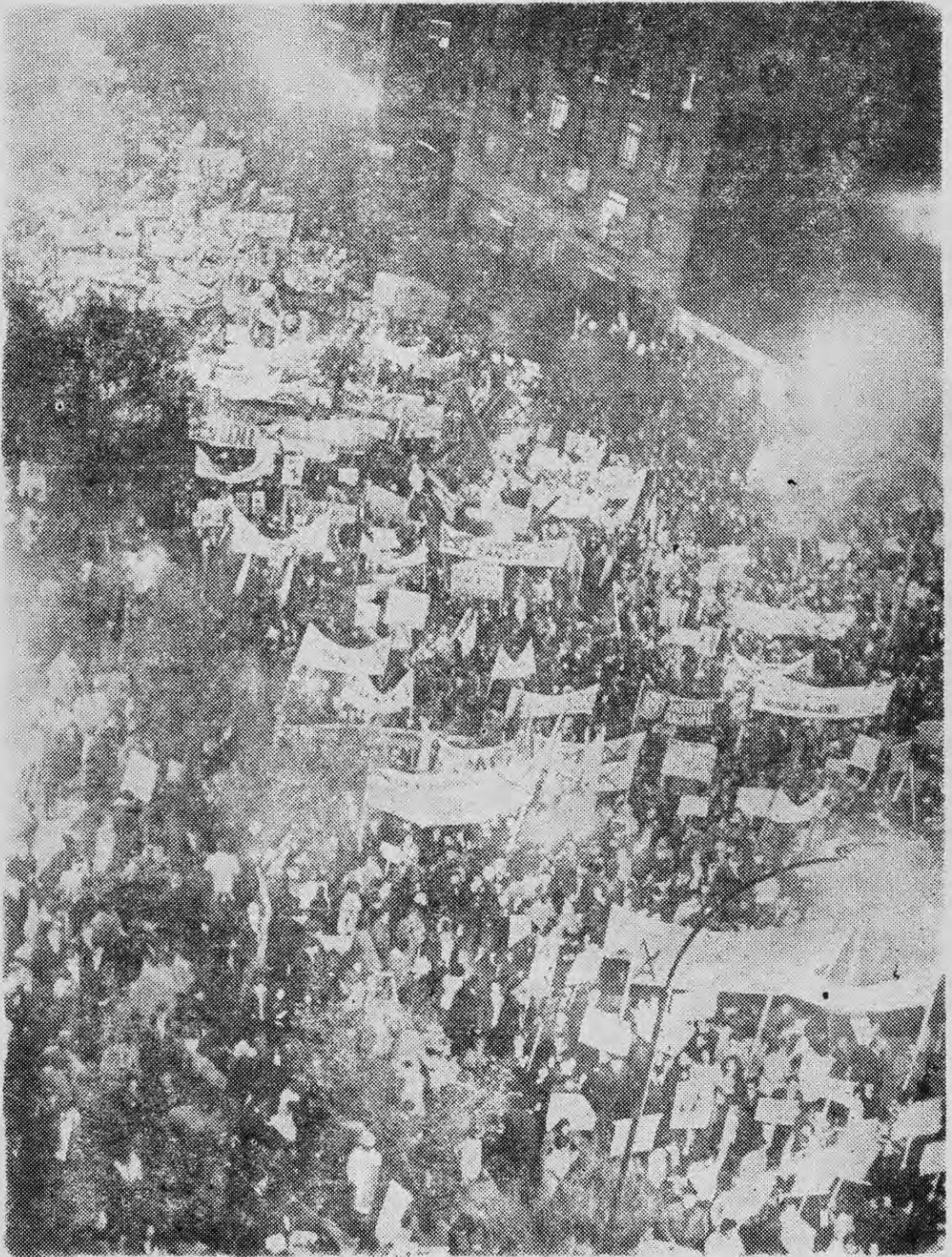
EL PUEBLO DE SANTIAGO se volcó a las calles en los últimos actos de la campaña electoral de la Unidad Popular en septiembre de 1970.