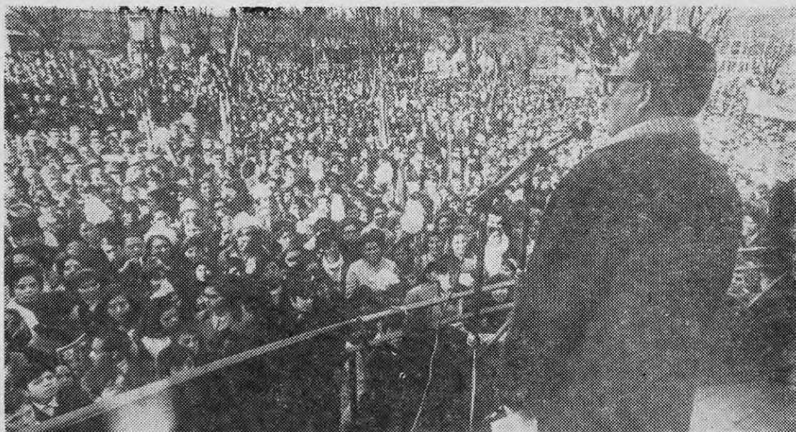
LAS MASAS trabajadoras respaldan al Gobierno de la Unidad Popular.

carbón, del diálogo con los dirigentes sindicales o con los pobladores, el vivir sus inquietudes, el oír sus críticas a lo que estamos haciendo, pone un empuje mayor a la obra revolucionaria en que estamos empeñados. Si acaso me sometiera a la vida tradicional de un Presidente, si acaso no tuviera conciencia muy clara de que no se trata de llegar a la presidencia para mantener lo existente sino para transformarlo en forma revolucionaria, es posible que me sintiera amargado por las trabas formales en que se mueve un Presidente tradicional. En cada uno de los aspectos protocolares, uno puede ir mostrando un criterio distinto desde lo más simple hasta lo más significativo. Aquí ya nadie usa frac para las ceremonias oficiales, tampoco utilizamos más las carrozas de Palacio. Hemos roto el concepto tradicional del protocolo. ¿Por qué? Porque cuando conversamos con la gente le planteamos nuestros puntos de vista, señalamos lo que somos, dónde vamos. No son conversaciones sin contenido. Se trata de utilizar los canales diplomáticos para hacer conciencia de cuál es la realidad a la cual estamos enfrentados.