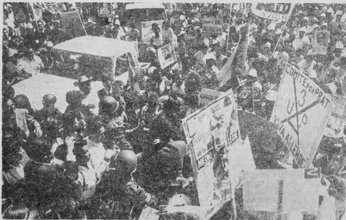
LA ELECCION PRESIDENCIAL: Una sorpresa para la oligarquía y el imperialismo.

perencia ancestral en el arte de la fagocitosis (lo que se podría llamar: la destrucción por asimilación del cuerpo extraño) para desviar el impacto de los proyectos de ley propuestos a la aprobación del Parlamento por el Gobierno Popular. La burguesía no dice no en principio a los proyectos de nacionalización de las compañías norteamericanas del cobre o de formación de los tribunales populares a escala local: la oposición de derecha acepta la discusión en comisión del proyecto de ley, su inspiración general, pero allí mediante observaciones de detalles y con indicaciones en las discusiones plenarios logra suavizar insensiblemente las aristas afiladas, pero sin llegar a exponer el flanco a un ataque frontal de las fuerzas populares. En general, lo habitual es que los choques, los conflictos de clase en el plano de las luchas cotidianas, sigan insolubles en tanto que la designación de una comisión parlamentaria no ha sido decidida. La salida del enfrentamiento se encuentra suspendida hasta la aplicación del reglamento o de la disposición correspondiente, el enfrentamiento mismo se convierte a la postre en discusión jurídica o en negociación de pasillo a propósito de un texto legislativo. La violencia represiva, si es necesario, hace correr la tinta antes que la sangre. Pasa primero por el papel impreso del Diario Oficial de donde ella salta a