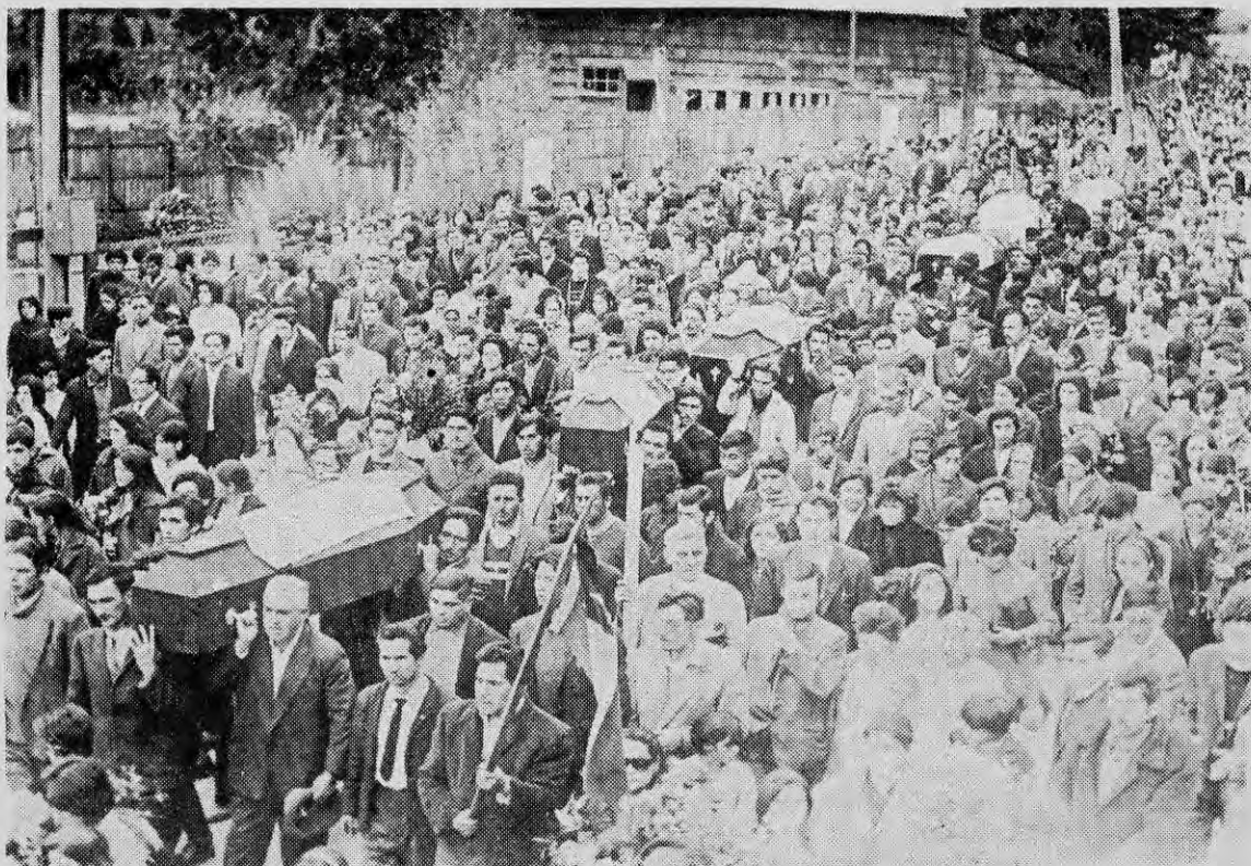
LA MASACRE DE PUERTO MONTT ensangrentó a la Democracia Cristiana.

dignación, provocan, pero sin éxito, campañas de prensa. El descaro de los sectores reaccionarios, que con una mano preparan directa o indirectamente una serie de atentados contra la vida del Presidente y protestan con la otra contra las medidas de seguridad que éste último se ve obligado a adoptar, es demasiado burdo para pasar inadvertido. Vale la pena señalar que el MIR (Movimiento de Izquierda Revolucionaria) ha puesto también a disposición del gobierno popular y del compañero Presidente —quien le ha rendido público homenaje— su propio aparato de inteligencia, notablemente eficiente puesto que contribuyó a prever, descubrir y al mismo tiempo prevenir diversas operaciones subversivas de la reacción, conducidas con la ayuda del extranjero. Debe recordarse que si bien el plan de asesinato del Comandante en Jefe del Ejército no pudo ser detectado a tiempo, al menos los preparativos del golpe de Estado habían sido públicamente denunciados, en base a pruebas y evidencias, por el MIR en los días posteriores al 4 de septiembre.