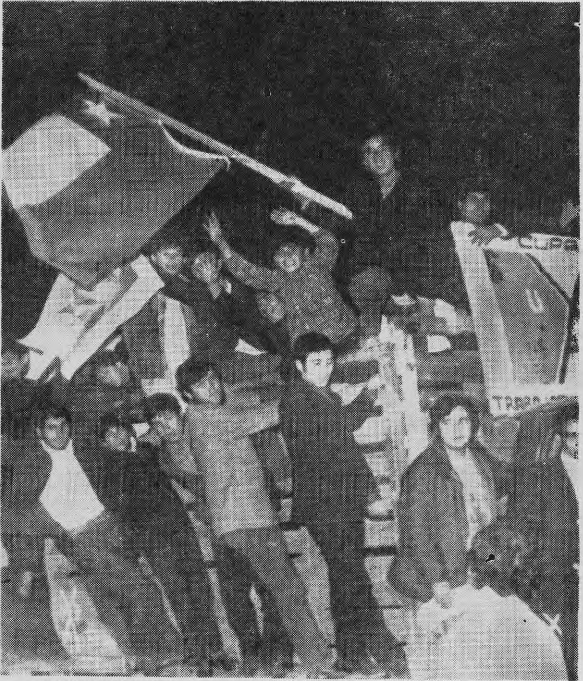
EL PUEBLO CHILENO es el protagonista del proceso que se inició en nuestro país.

ALLENDE: No, ya te lo he dicho; los Jefes de Investigaciones estaban comprometidos.