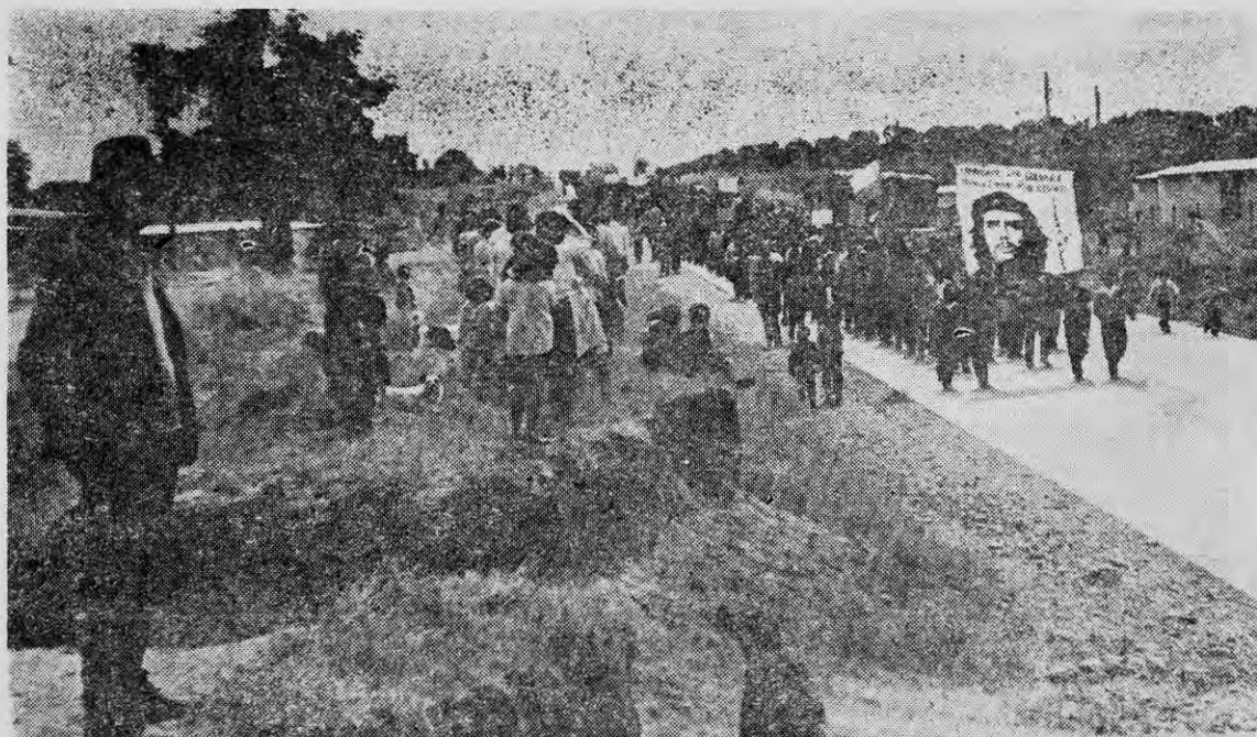
Los campesinos chilenos han despertado y luchan por la tierra y el socialismo.