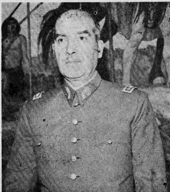
GENERAL RENE SCHNEIDER: víctima de la Derecha.

Tratemos de encontrar los principales de ellos, del más simple al más complejo: los conflictos de influencia, notables a lo largo del siglo XIX entre los imperialismos británico y norteamericano, después el alemán al fin del siglo, se neu-