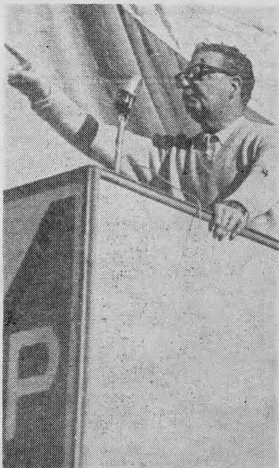
ALLENDE sostiene un diálogo permanente con los trabajadores de la ciudad, el campo y las minas.

ALLENDE: Yo creo que los que han leído a Lenin y especialmente su obra "El Imperialismo, fase superior del Capitalismo", ya tienen los conceptos teóricos. Esta cuestión del imperialismo tiene una connotación principal en los países subdesarrollados y, especialmente, en los de América latina. Los socialistas advertimos que nuestro enemigo número uno es el imperialismo y por eso concedimos, y aún lo hacemos en la actualidad, primera prioridad a la liberación nacional. La penetración y dominación del capital foráneo se ha acentuado en los últimos años hasta hacer casi invisible la burguesía llamada nacional. El Partido Socialista tiene una tradición antimperialista que se liga en la historia al proceso conocido en nuestro país como "Revolución Socialista" y que co-