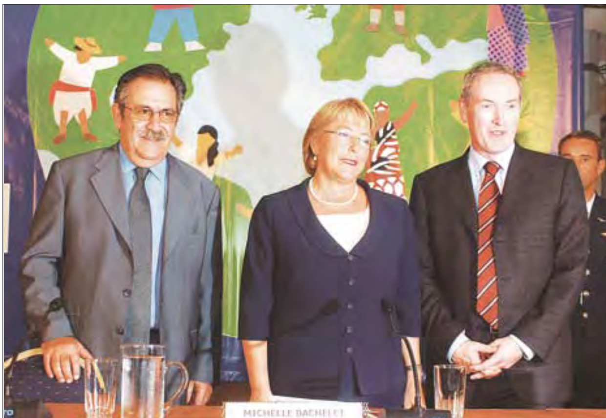
En la inauguración del Seminario, el senador Ricardo Núñez, la Presidenta Michelle Bachelet y John Hutton, Secretario de Estado para el Trabajo y la Previsión Social del Reino Unido.