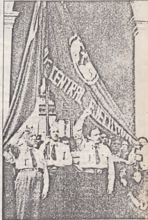
Lideres socialistas del Frente Popular en La Moneda.

políticas en que se desenvuelve la acción de los Estados, tres son las fuerzas principales que se manifiestan en la realidad internacional (...): el alto capitalismo financiero que, en conformidad al principio de libre empresa, procura mantener en pie la quebrantada estructura del régimen burgués; el comunismo soviético, que sirve de vehículo al afán hegemónico y nacionalista del Estado ruso; y el socialismo revolucionario, que aspira a la efectiva liberación económica y política de las masas trabaja-