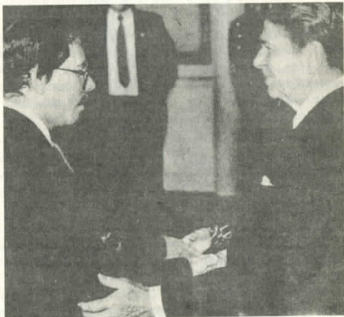
Ortega y Reagan frente a frente

como instrumento político contra el imperialismo, en la que amplias capas populares vienen curtiéndose en el contexto de libertad de expresión que trae la revolución. Pero si la agresión continúa, si el Congreso sigue financiando a las bandas mercenarias y la Administración Reagan sigue empeñada en asfixiar económicamente al país el Frente Sandinista se verá arrastrado a imponer la disciplina interna, radicalizándose en el interior, restringiendo algunas libertades y reprimiendo a la oposición interior cómplice de EE.UU.