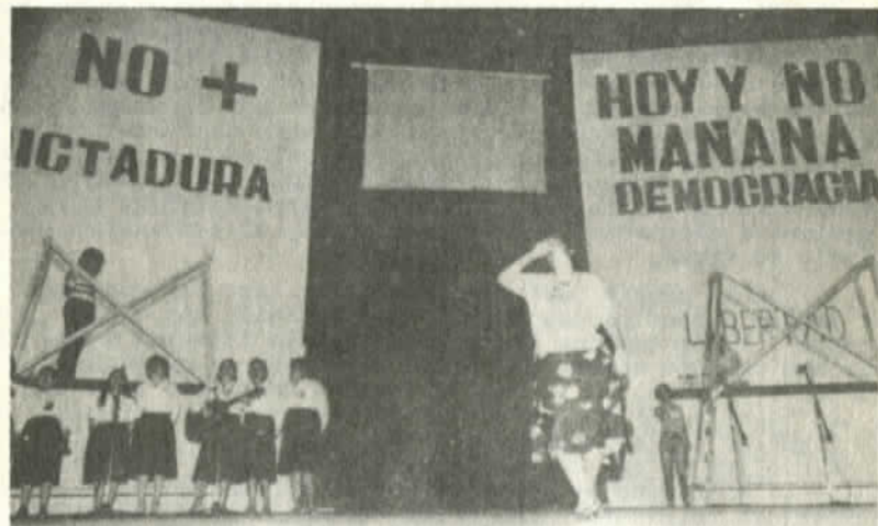
"Ellas danzan solas"

Para "Ellas danzan solas", Sting contó con la colaboración de Marx Knofler, de Eric Clapton y del baterista africano Manú Katché. Aquí va la letra completa: