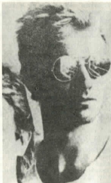
Sting idolo Pop

Allí está Sting (36, libra, ex profesor de literatura inglesa, nombre verdadero: Gordon Matthew Sumner) en una sala del Sheraton de Buenos Aires, que más parece un cine. Recién duchado después de un baño en la piscina, con un collar que le regalaron en el Amazonas, con un chaleco negro un poco largo, fotografiado sin pausa por un centenar de reporteros gráficos. Se trata de una conferencia de prensa a "nivel internacional", que hace de inmediato comprender la ironía con que Los Beatles tomaban estas cosas. Hay unos doscientos asistentes, entre periodistas y "colados". También hay tres chicas Pepsi con sendos micrófonos para distribuir las preguntas. La primera en hablar es una periodista de "Página 12", que introduce, en inglés, a dos representantes de las Madres de la Plaza de Mayo. La con-