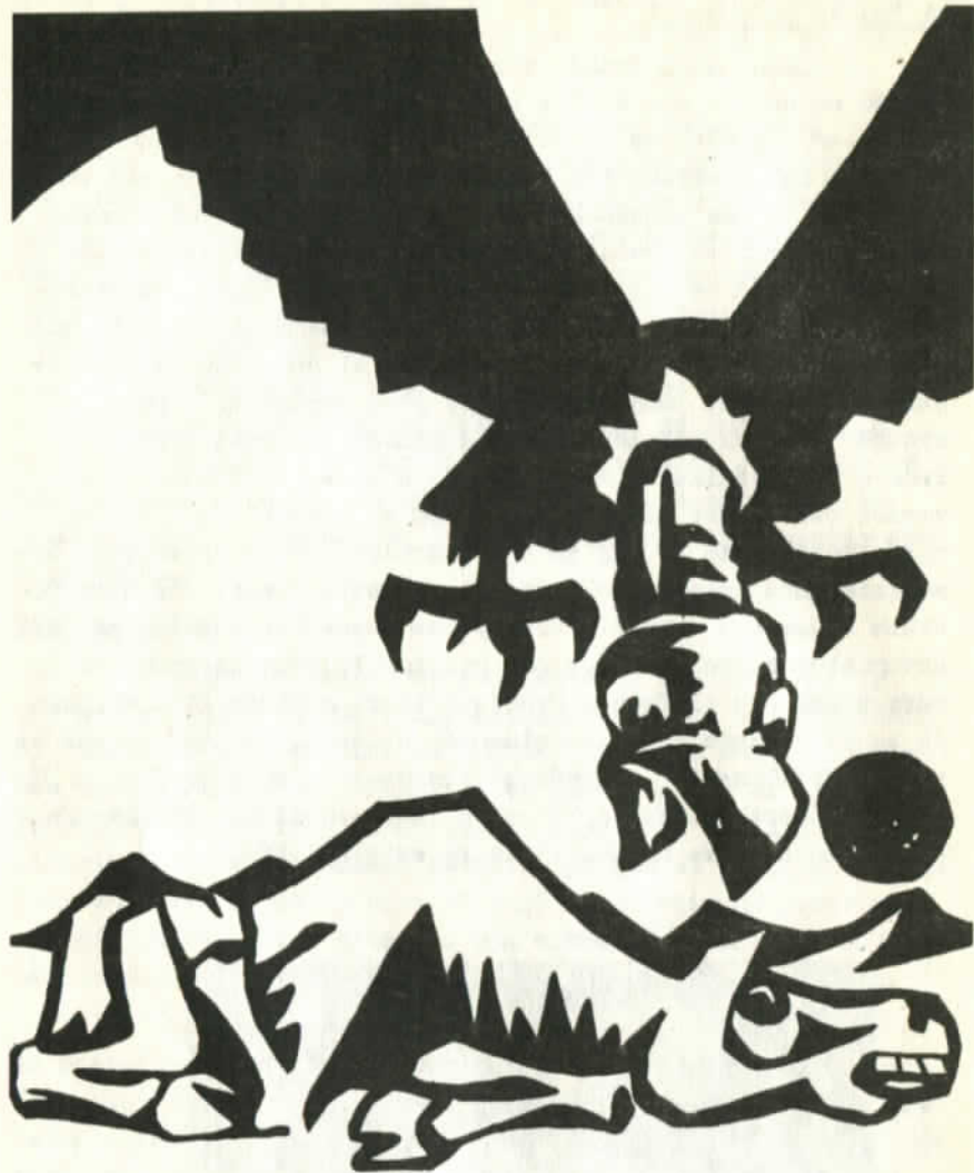
Grabado de Héctor Tobar