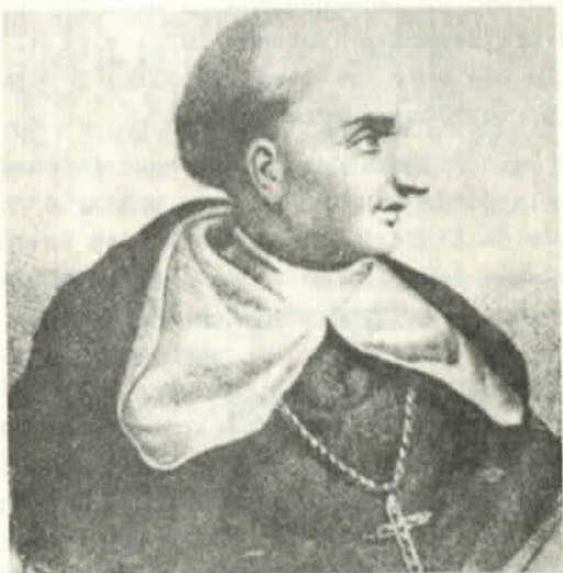
Fray Las Casas: la verdad

bemos nada, porque se extinguieron rápidamente después de la venida de los españoles. El describe a estos habitantes como seres primigenios que viven en la inocencia paradisíaca más absoluta, desnudos, ingenuos, algo estúpidos -se interesan en cuentas de vidrio sin valor, en los botones- especialmente, porque miran a los blancos como seres venidos del cielo. Además, dispuestos a aceptar la santa religión católica "pues al parecer ellos no tienen ideas religiosas". Ni la ingenuidad, ni la belleza primigenia fueron impedimento para raptar a algunos ejemplares y exponerlos en España como animales raros.