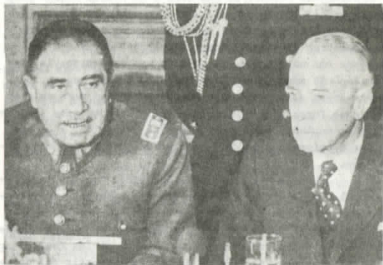
El dictador y Ortuzar

¿Quién otro podrá proyectar de mejor forma la — "obra" de las fuerzas armadas a los abismos de la historia, que el propio sátrapa?.