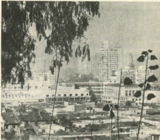
Panorama de Santiago

Los más proletarios son los "taquillas". Con dificultades pueden hacerse de una vestimenta "Adidas" o lucir, por el barrio Bellavista, una tenida con la apetecida marca "Levis Strauss" legítima, pero de segunda mano. Llevan pantalones "amasados", de algodón, como si les faltara plancha. Intentan hacerse de alguna mezclilla "nevada", de esas a manchones blancos como si les hubiera llovido cloro. En cuanto a los "artesa" se distinguen porque echan mano a cualquier tejido de hechura artesanal y que les cae de forma descuidada.