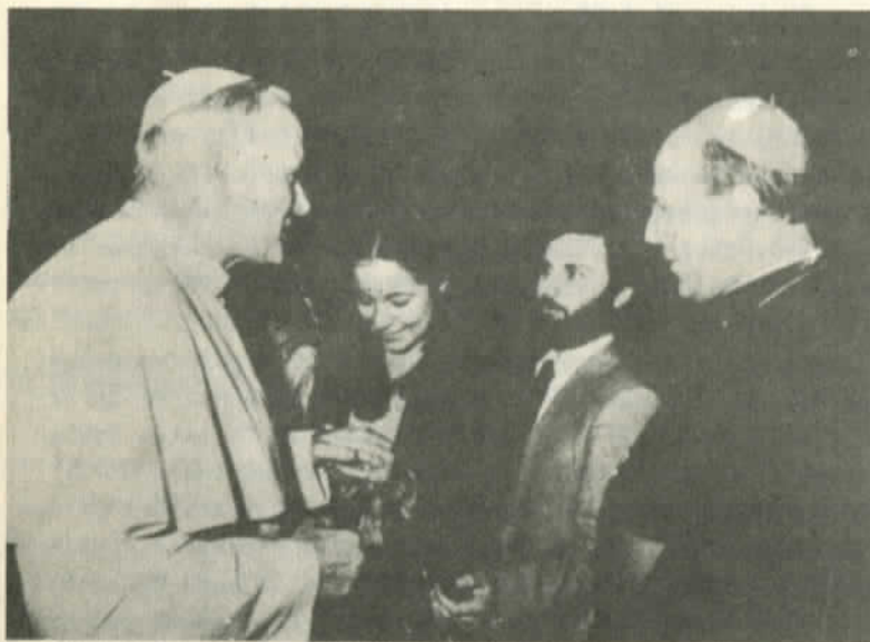
Juan Pablo II en Chile

del país; en cambio, el católico "Mensajero de la Vida" era un socorro para los familiares de los 30.000 asesinados después del golpe de Estado, de los 2.500 desaparecidos de estos años y de los actuales 600 prisioneros políticos. Detrás de esta bienvenida de la Iglesia se hacían presente estos fantasmas reales, que atormentan las noches de Pinochet (y no sólo de él).