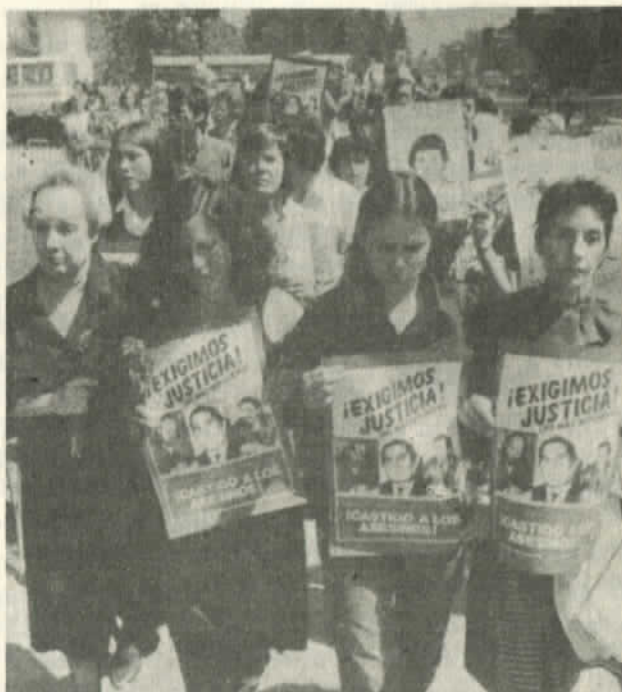
Victimas del modelo CIA

"Después del golpe, la CIA renovó sus lazos de relación con las fuerzas de inteligencia y seguridad del gobierno chileno, relaciones que habían sido interrumpidas durante el período de Allende." "Los funcionarios admitieron que, aunque la mayor parte de la asistencia de la CIA a las diversas fuerzas chilenas estaría destinada a respaldarlos en el CONTROL DE UNA SUBVERSION PROCEDENTE DEL EXTRANJERO, la ayuda podría ser adaptada también al control de la subversión interna."