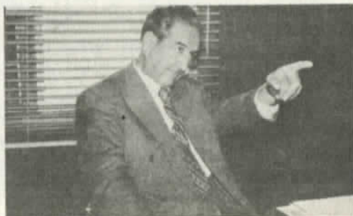
Durán: un bien pagado

Durante el período de la Unidad Popular, la CIA consigue desgajar una vez más a un sector de este partido, que creó el Partido Izquierda Radical (PIR).