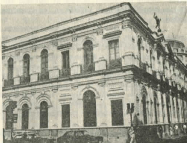
Sede de "El Mercurio"

llones para partidos políticos de oposición en Chile. La mayor parte de este dinero fue al Partido Demócrata Cristiano (PDC), pero una porción sustancial fue destinada al Partido Nacional (PN), una agrupación conservadora que se oponía con más estridencia que el PDC al gobierno de Allende. Se hizo también un esfuerzo para romper la coalición de la Unidad Popular que gobernaba, por medio de la inducción de elementos que formaban parte de ella para que la abandonaran."