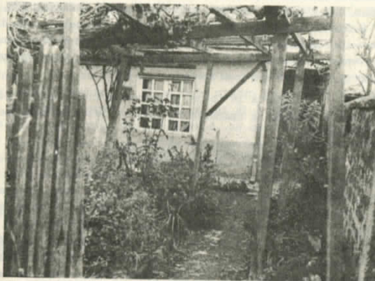
En Recoleta: la llamada "casa de seguridad".