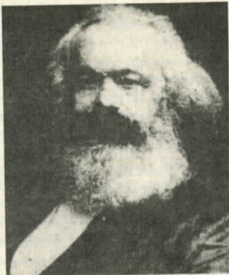
Marx, el maestro