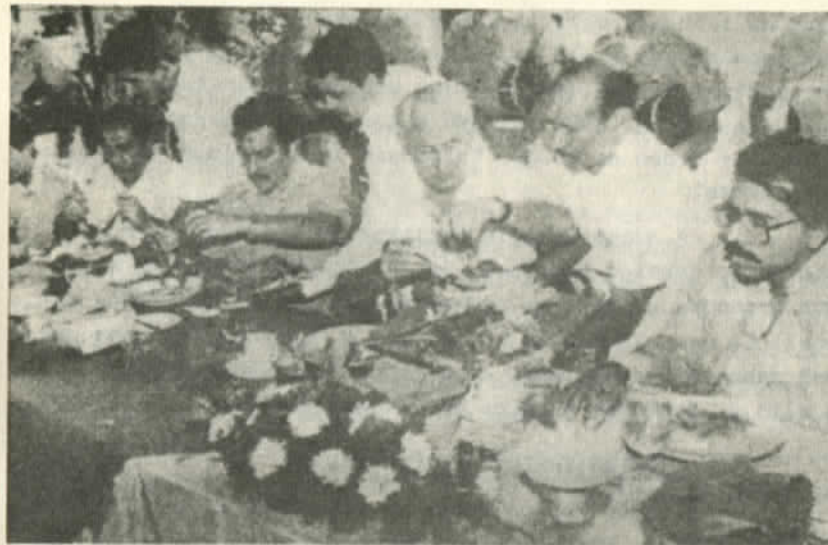
Los presidentes de Centroamérica.

Las autoridades costarricenses no permiten a los contrarrevolucionarios nicaragüenses a esgrimir las armas con demasiado ruido., pero sí les dan carta blanca para la actividad política. Rodrigo C arazo dijo que ahora, gracias a los esfuerzos de la administración Monge los contras molestan menos que antes. Pero es tradicional -observó- que Costa Rica brinde asilo político a cualquiera. Aprovechando esta circunstancia, los contra desarrollan actividades políticas subversivas contra Nicaragua cuando no recurren a acciones violentas o atropellan las leyes de Costa Rica.