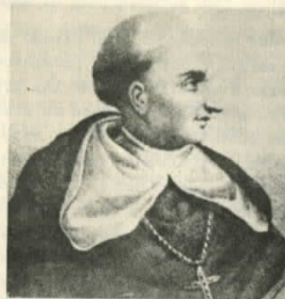
Fray Bartolomé Las Casas

escribe Lipschutz, Fray Bartolomé de Las Casas hablaba y escribía en el siglo XVI con una visión clara de las cosas, no sólo de su propio presente, sino también del gran futuro... Las Casas pertenece a los tiempos todos, a los hombres todos como intérprete de la auténtica conciencia humana que se rebela contra la injusta guerra, contra la conquista y contra la explotación del hombre por el hombre". (9)