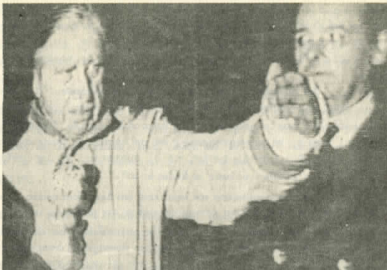
Pinochet con miedo