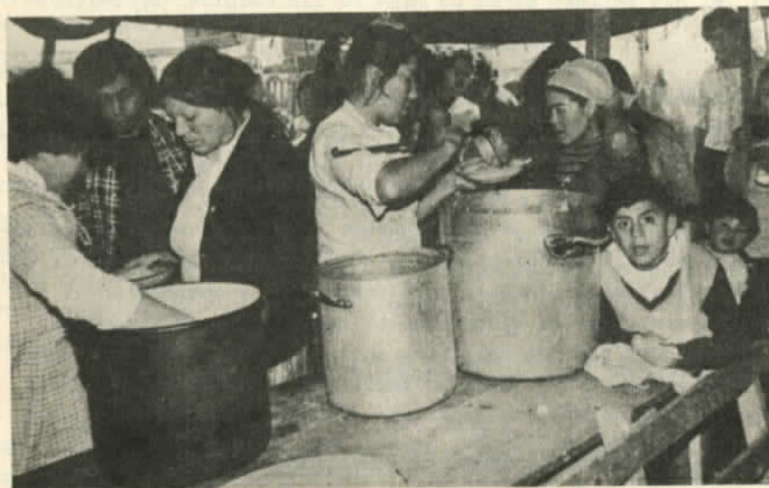
Ollas comunes para textiles cesantes

- Rotundamente no. Todas nuestras conquistas fueron arrasadas. Se nos aplica la ley 1 200 y el Plan Laboral que protege a los patrones y deja al gremio a merced de la mayor explotación o de la cesantía. Se nos ha arrebatado todo. No somos tan ilusos como para esperar alguna solución que parta de la iniciativa del régimen.