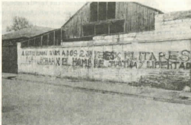
El lugar del crimen

Dos horas más tarde, a las 4 de la madrugada, desconocidos llegaron a la calle Fidel Angulo 1109, en San Bernardo. Gastón Vidaurrazaga Manríquez, 28 años, profesor fue secuestrado, mientras su esposa Marisol Aras Cabrera y su pequeña hija buscaban refugio en el patio posterior de la casa. El cuerpo del profesor apareció en la ruta cinco Sur con 20 balazos.