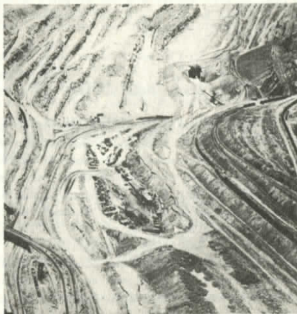
Chuquibambilla desde el aire