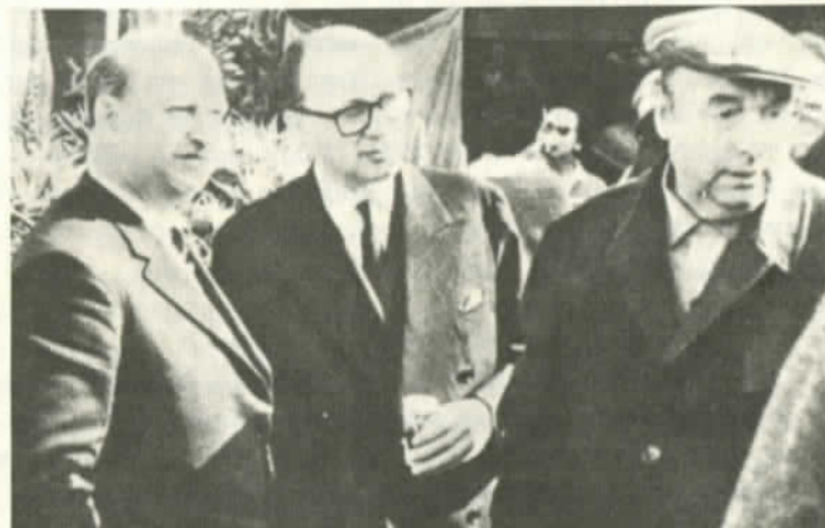
Volodia (a la izquierda) con Agosti y Neruda

Se apropiaba así, en audaz desafío, convirtiéndolo en timbre de orgullo. Del epíteto que la prensa burguesa aplicaba rabiosamente a los dirigentes comunistas, como la peor injuria. Reivindicaba con altivez proletaria la alta y pura función del hombre que dedica su existencia entera a la causa de la revolución, de acuerdo con el concepto de Lenin sobre el revolucionario profesional.