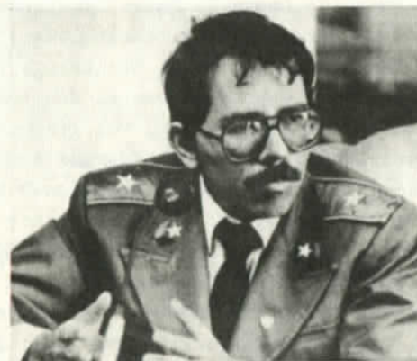
Presidente Daniel Ortega

Conocidos los resultados de la reunión de Caraballeda el presidente nicaragüense Daniel Ortega, instó al mandatario estadounidense, Ronald Reagan, a suscribir el documento aprobado en Venezuela. Agregó que Nicaragua y EE.UU. por medio de la firma del Documento, se pueden comprometer a poner en ejecución los nueve puntos contenidos en la declaración final.