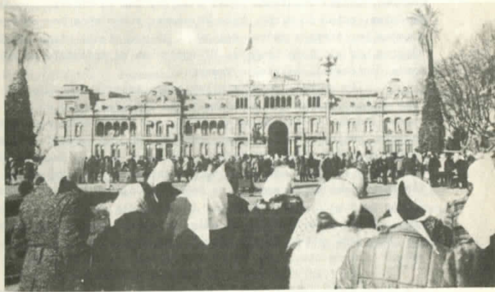
Las tenaces madres de "La Plaza de Mayo"