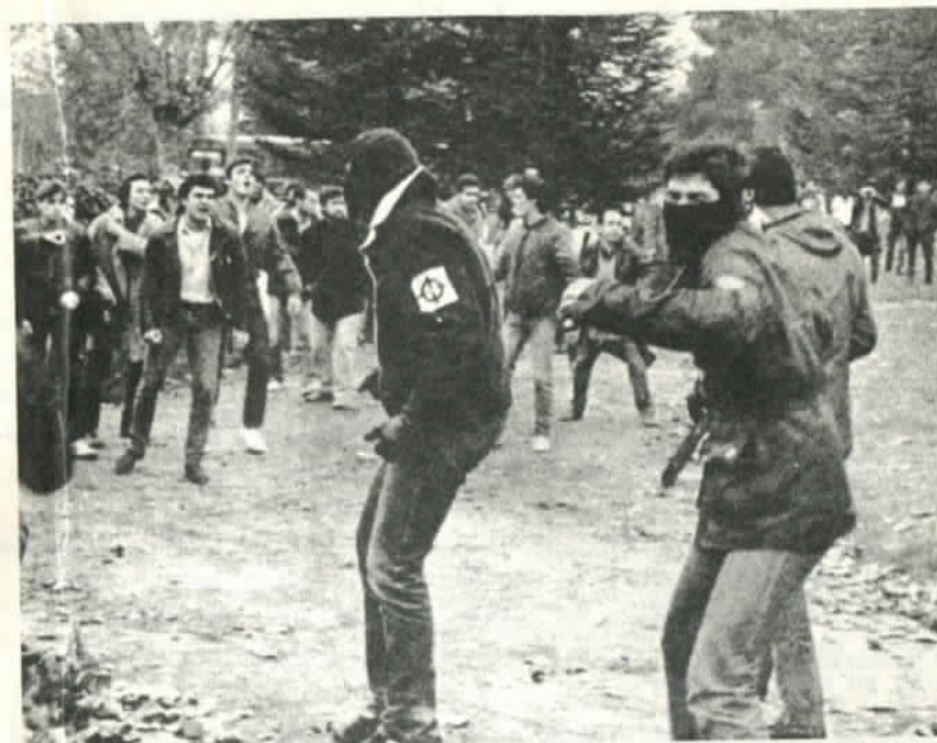
Estudiantes enfrentan a garkas