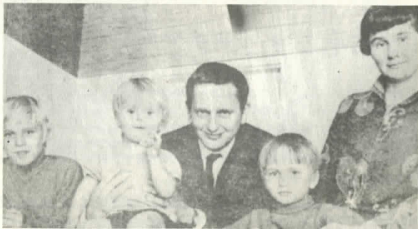
Palme con sus tres hijos y esposa