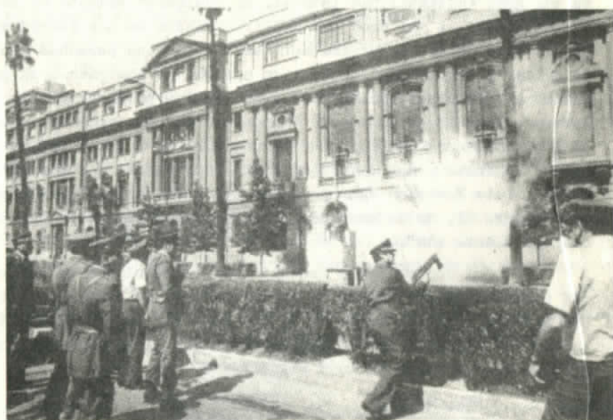
Carabineros contra la UC