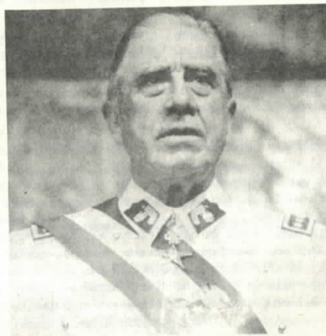
El Capitan General: ¿Busca sucesor?

Para decirlo de otra manera, las opiniones de Zara sólo pueden ser evaluadas como un pronunciamiento político castrense. Un acto de deliberación.