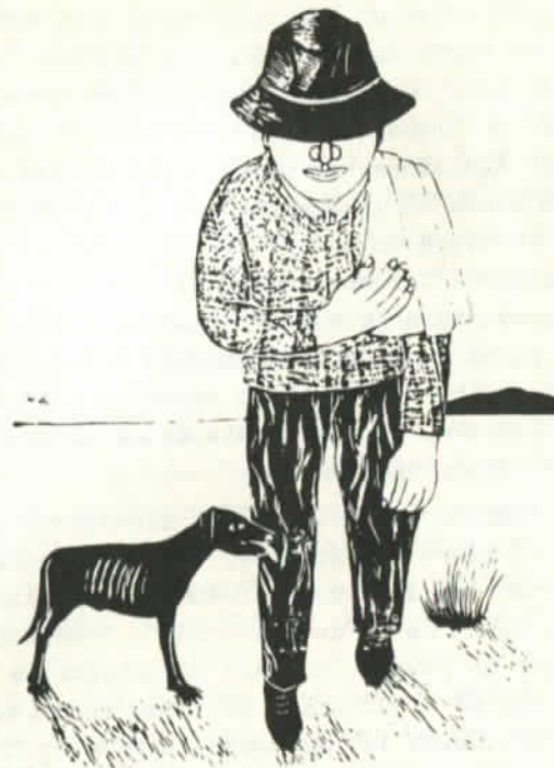
Grabado de Santos Chavez

Estas, añadidas a innumerables actividades artístico-cultural previas a 1970, durante el Gobierno Popular sirvieron de base al Tren de la Cultura, formidable avanzada ideológica que recorrió el país llevando consigo el teatro, la pintura, la música, el ballet, la literatura, en fin, la luz hacia esos apartados, abandonados, olvidados caceríos y villorrios donde antes de la creación de aquél sus míseros habitantes jamás supieron qué significa luz.