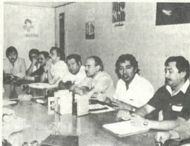
El Comando discute el Paro

La reunión del CNT no se quedó en el paquete de reivindicaciones sociales y políticas internas, sino que asumió una clara posición de solidaridad con los pueblos agredidos por el imperialismo, condenando la agresión en contra de Nicaragua y Libia; acordó luchar por el no pago de la deuda externa y respaldó la posición del Presidente del Perú, Alán García, quien expulsó de ese país a los representantes del Fondo Monetario Internacional.