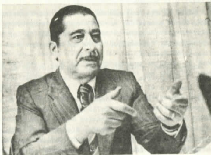
General Arellano sin uniforme

implicado en el asesinato de Orlando Letelier. La querrela criminal por el asesinato de Carlos Berger señala que "además del general Arellano Stark, y según otros antecedentes recogidos, son también responsables de este homicidio los oficiales de Ejército, Marcelo Moren Brito y Armando Fernández Larios, quienes integraban la comitiva mencionada y participaron como miembros del pelotón de fusilamiento". La misma querrela precisa que "diversos antecedentes, entre ellos declaraciones judiciales del mayor de Ejército (R) Reveco, señalan como integrantes del comando asesino a los funcionarios militares Marcelo Moren y Armando Fernández Larios".