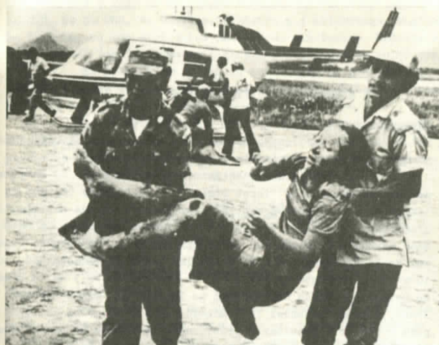
Rescate de sobrevivientes