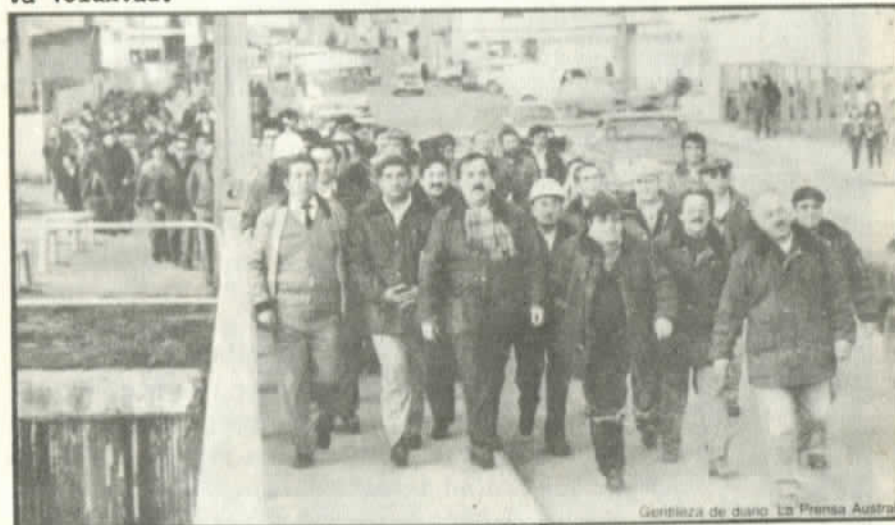
Trabajadores del Petróleo en Punta Arenas

da. No hay ningún proyecto democrático posible sin ellos. La iniciativa del Cardenal Fresno para impedir las protestas de septiembre cayó en el vacío. De todas maneras las masas -y entre ellas, los trabajadores democristianos- obedecieron los acuerdos del CNT y el país prácticamente se paralizó esos días. A consecuencias de eso fueron encarcelados Bustos, Seguel, Di Giorgio y otros destacados sindicalistas de la DC. Ellos cumplieron un acuerdo de los trabajadores. Y demostraron que las masas están dispuestas a combatir y que nadie puede frenar esta voluntad.