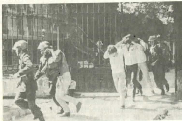
Desalojo policial de Ingeniería

especular que mucho más difícil ha resultado explicar el escaso margen de diferencia con que ganaron la elección. También debe ser motivo de reflexión al interior de la DC el prácticamente nulo crecimiento experimentado en relación a las elecciones del año pasado. Mientras que por un lado la derecha y por el otro la izquierda anotaron importantes aumentos en sus respectivas votaciones. (Cuadro)