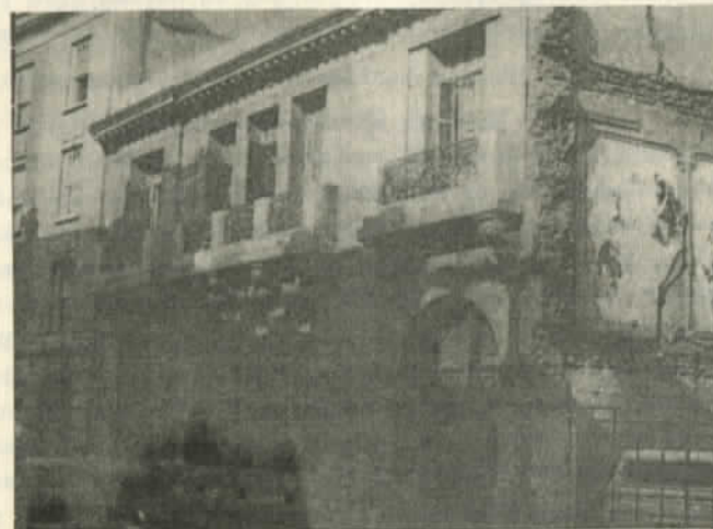
Londres 38: casa de torturas CNI