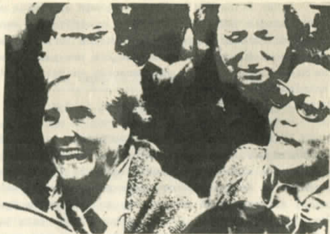
Las mujeres contra la dictadura

- Es dueño de una empresa mixta norteamericana que figura a nombre de un pariente vía materna. Se denomina "Matiuda Cement Company".