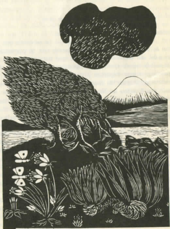
Grabado de Santos Chavez

REVISTA MENSUAL EDITADA POR EL COMITE EXTERIOR DE LA CENTRAL UNICA DE TRABAJADORES DE CHILE