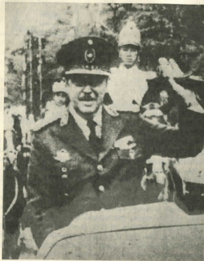
Stroessner en sus buenos tiempos