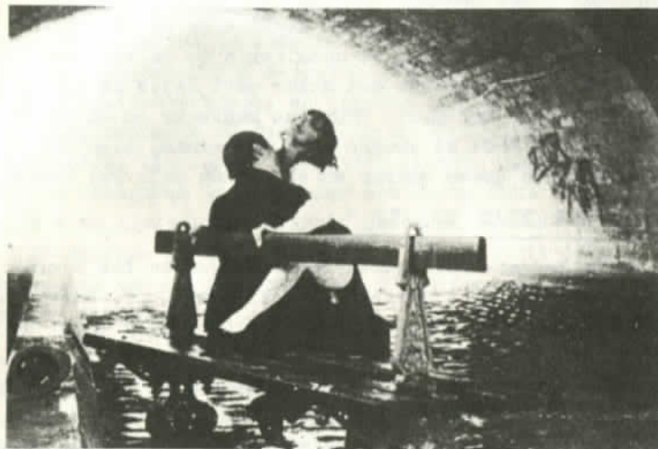
Una escena de "El Exilio de Gardel"

ciadores son grupos de base de mujeres, jóvenes, agentes pastorales, movimientos de defensa de derechos humanos y muchos otros se llega a un nuevo desafío frente a la visión unilateral y distorsionadora de la TV nacional. La dirección del Festival de La Habana ha respondido a tales exigencias de la realidad. Entre otras iniciativas del séptimo evento figura la integración de videogramas en la sección competitiva al lado de las de ficción, documentales, dibujos animados, guiones inéditos y carteles de cine.