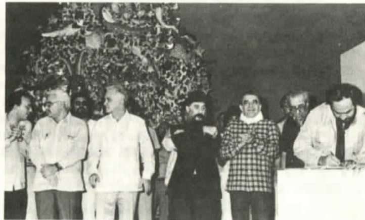
Berri, García Marquez, Littin en Festival de La Habana

En "La historia oficial" (Argentina) de Luis Puenzo un drama psicológico sirve de portador de pesares cataclísticos de toda una sociedad. Alicia, mujer culta del alto estrato social, empieza a captar la identidad verdadera de su hija adoptiva y por ende la infamia de un sistema hasta entonces aceptado. Pues Gaby es hija de padres jóvenes secuestrados y asesinados por el régimen militar. Norma Leandro, actriz principal interpreta la búsqueda inexorable y destructora de sí misma con verdadero talento de figura trágica.