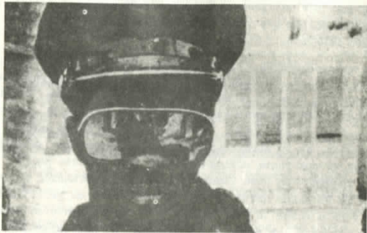
Los sangrientos "Tontons macoutes"