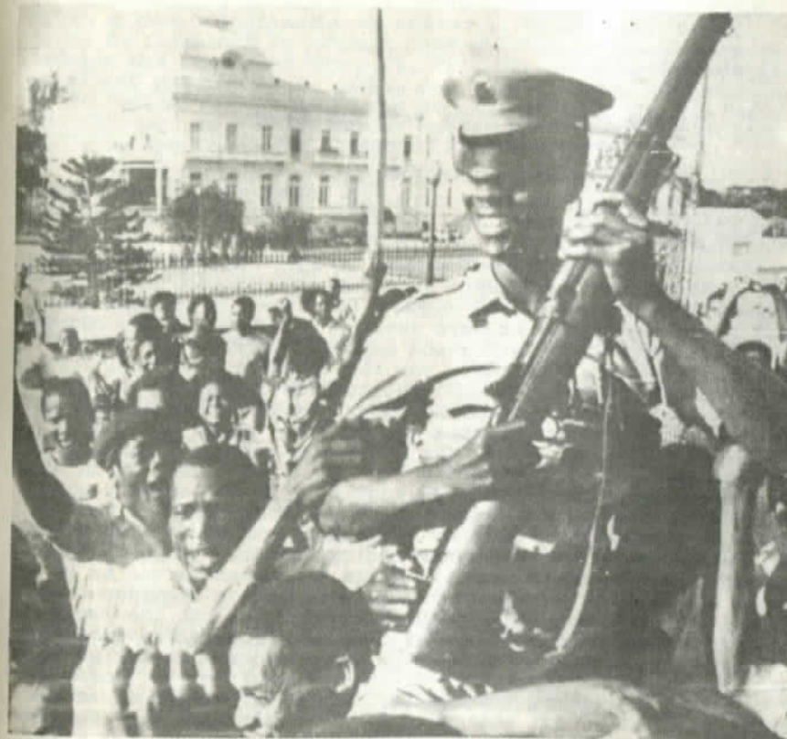
Euforia después de la caída