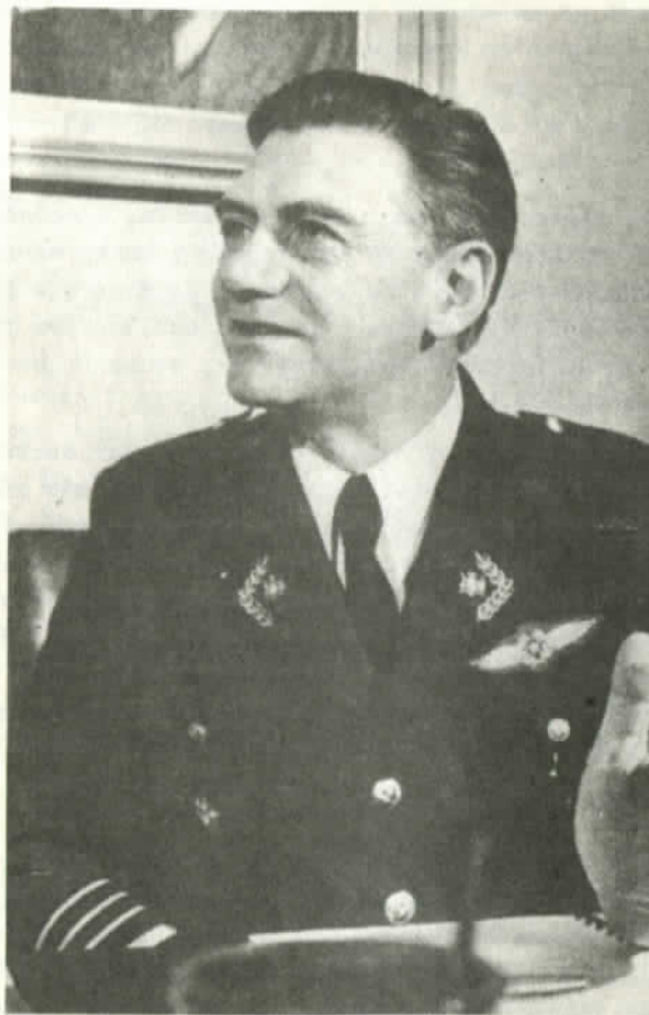
Fernando Matthei: "No sé si será moral o no"