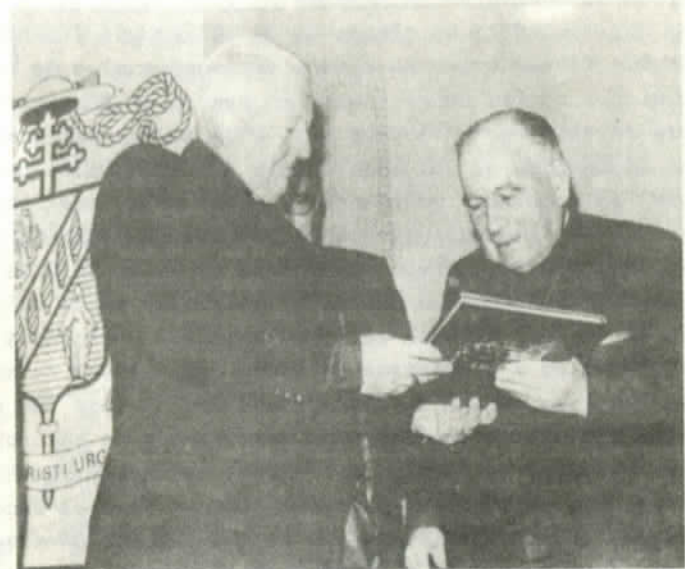
Dos caras de la Iglesia: Fresno y Silva Henriquez

católica. La prensa ha informado en Europa insistentemente de que el Opus Dei estaría entrando a controlar el IOR, Banco del Vaticano, que hizo negocios de malas consecuencias con la logia masónica P-12. Simultáneamente, va ocupando gradualmente posiciones en la Universidad Católica de Milán. Su actual jefe mundial, el "prelado" Alvaro del Portillo, pasa por ser hombre de dos amos: antes que todo la C.I.A. norteamericana y, en segundo término, el propio Papa, hacia los cuales divide compartimentadamente su devoción.