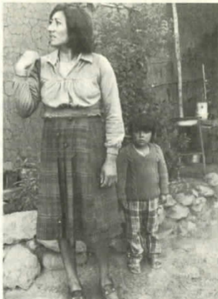
¿Que hacer para comer?

Como la oferta es amplia, también hay grados de sofisticación. En el rubro de "damas de compañía", por ejemplo, la persona encargada de recibir los datos de las postulantes, además de detalles anatómicos, requiere precisar estudios. También en los Top-Less son más cotizadas las niñas que "saben conversar", porque hay clientes que quieren básicamente alguien que les escuche (si bien la mayoría busca realizar aquí las fantasías que en su entorno no se permiten). De vez en cuando surge el rumor de un prostíbulo "con puras universitarias". También hubo una denuncia de prostitución en el recinto de una universidad de provincia, pero no hubo confirmación. Lo que se sabe es que algunas muchachas se pagan los estudios con estos oficios ("azafatas", generalmente. Hay moteles que ofrecen trabajos por horas).