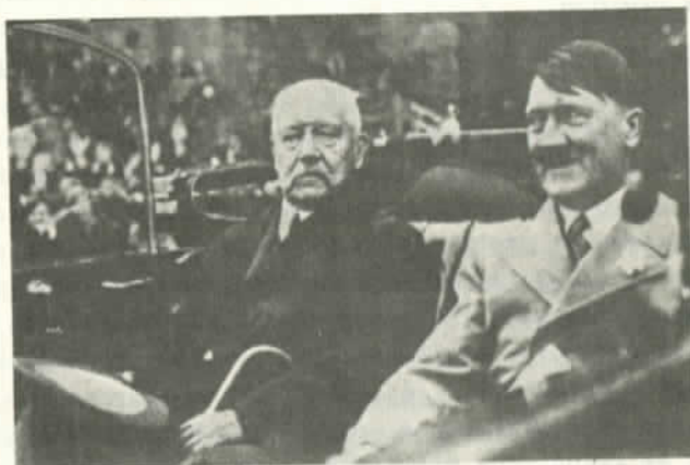
Alianza Hinderburg (los monopolios) con Hitler en 1933

los movimientos populares. Se fomenta el desarrollo y fortalecimiento de dos partidos: el Demócrata Cristiano y el Socialdemócrata. El primero sirve de alero a un abanico clasista que va desde nazis y conservadores hasta pequeños burgueses, campesinos y obreros. Todos ellos tienen el denominador común de ser cristianos. El segundo estaba destinado a recoger las inquietudes políticas de masones, no creyentes, y en general de quienes no participan de una ideología religiosa. Ambos partidos son pluriclasistas, fundamentalmente son dirigidos por los intereses de los capitalistas, aunque puedan ser instrumentos de grupos de intereses distintos en el interior de la misma clase.