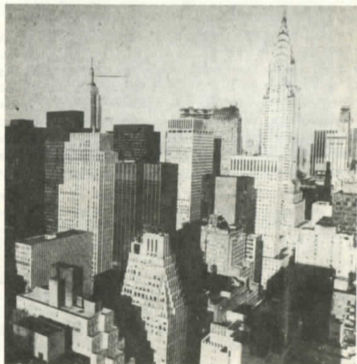
La Gran Ciudad del Imperio

y Vanzetti que fueron víctimas de las maniobras de estos grupos terroristas ayudados por la justicia clasista norteamericana. En la actualidad las centrales obreras norteamericanas CIO y AFL son instrumentos de los monopolios tanto a nivel nacional como internacional. A partir del término de la Segunda Guerra Mundial ha habido por parte de la CIA y de la Democracia Cristiana de derecha o sus equivalentes políticos, una campaña sistemática para debilitar las centrales clasistas en toda Europa, y en general en todas partes. Por ejemplo, en Francia y en Italia, al lado de las centrales obreras clasistas -COT y CGT- han aparecido centrales divisionistas tendientes a debilitar la acción unitaria masiva de la clase trabajadora. Los resultados obtenidos por las transnacionales son más bien desilusionantes. Los intentos, sin embargo, siguen con gran intensidad y se han extendido a otras partes del mundo.