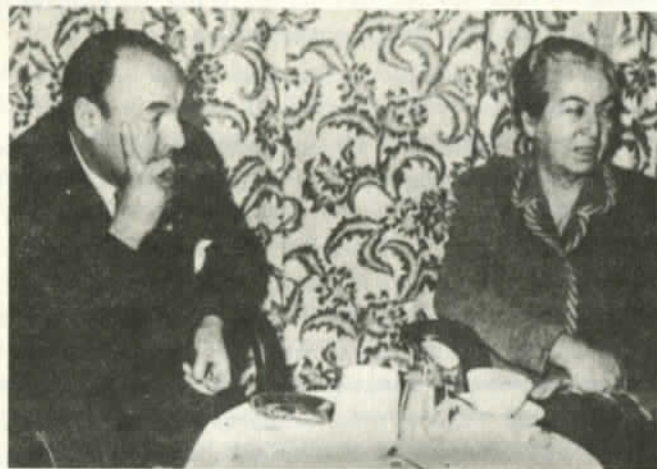
Gabriela y Neruda en Rapallo (1950)

cados" que se publicaban en "El Nacional" de Caracas, "El Tiempo" de Bogotá, "El Popular" de La Habana, "La Nación" de Buenos Aires y "El Mercurio" de Santiago. Sólo en el diario de los Edwards fueron suprimidas de pronto sus colaboraciones. Les pareció que era un vocero del Frente Popular y que caía demasiado en la tentación de hablar de la reforma agraria, de la educación democrática, de la explotación de los trabajadores, del saqueo y destrucción de la cultura indígena, etc. Cuando pidió explicaciones le dijeron simplemente que no requerían sus artículos, que no encajaban en la línea del diario.