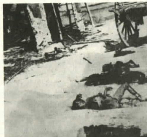
Matanzas diarias de campesinos

Estas entre otras, son las razones que obligan a pensar en Guatemala. Un pueblo azotado por sucesivas dictaduras y que requiere de la atención y la solidaridad del mundo.