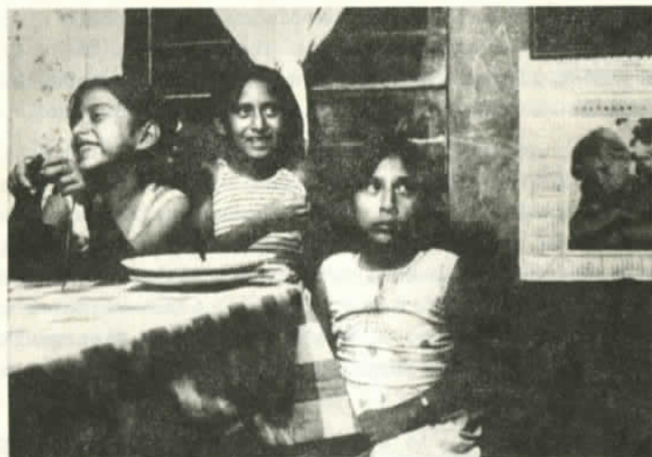
..."ellas se suben a un auto por lo que sea"

crea una suerte de contradicción entre los roles de madre de familia en el día y el de prostituta de noche. El paso de "señora" a "perdida", como señalan algunas de ellas.