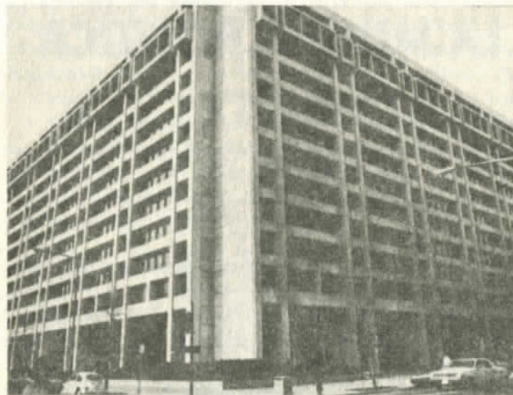
El edificio del FMI en Washington

vez más integrada y a la apropiación y distribución de los excedentes por parte del capital financiero en todo el sistema. Por otro lado, con el análisis de la fuga de capital es posible hacer una crítica tanto al sistema de crédito internacional actual como a la base monetaria de ese sistema de crédito, es decir, el dólar signo de valor nacional que actúa como moneda internacional.