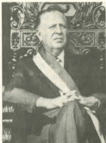
Belaunde Terry: derrota de la derecha

vo para que fuera posible. Otras tesis plantean la posibilidad de que el candidato de la Izquierda, Alfonso Barrantes renuncie a presentarse por segunda vez. Pero más allá de presiones y de ideas que surgen de un lado y otro, todo indica que habrá segunda ronda para ratificar un triunfo que ya es claro y que el próximo presidente de Perú, será por primera vez, después de 54 años de su fundación por Victor Haya de la Torre, un militante del APRA, Alan García.