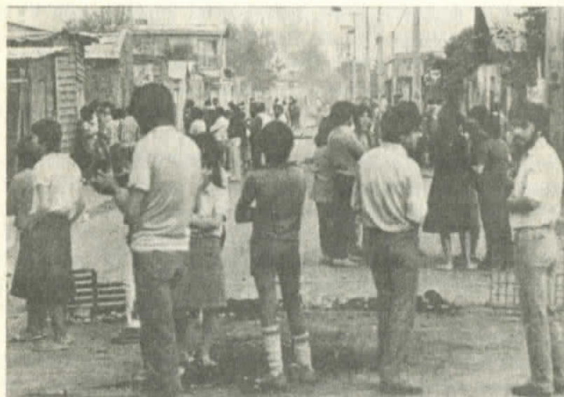
Las poblaciones: siempre hambre y represión

Dei y los sectores neo fascistas se expresan a través de los grupos conservadores, gremialistas y de las organizaciones políticas que la dictadura quiere crear para su perpetuación. Los sectores centristas de la Iglesia están conformados por la DC. Y los izquierdistas por los partidos obrero-cristianos, los partidarios de la teología de la liberación, los curas y monjas de la nueva generación que tienen contacto con los pobladores y con la vida misérrima del pueblo real en los lugares mismos en que viven.