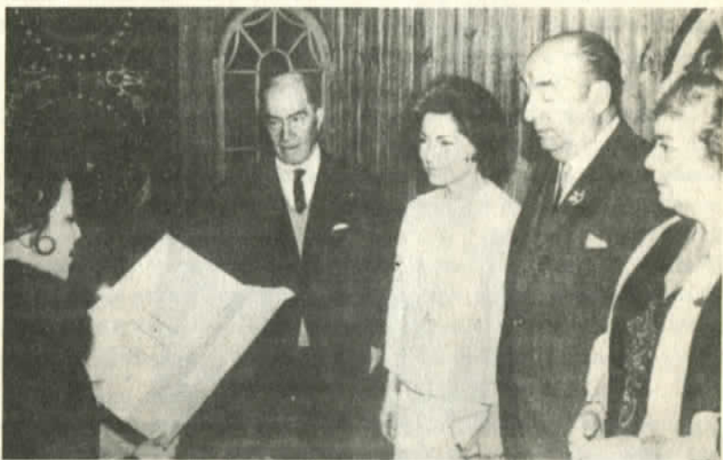
Casamiento en Isla Negra

ahí empezaron mis giras por México y otros países. Hasta filmé una película en Perú. Canté en la radio en Buenos Aires y Ciudad de México. Más tarde me dediqué a la enseñanza musical con una amiga. Me encantaba dar clases".