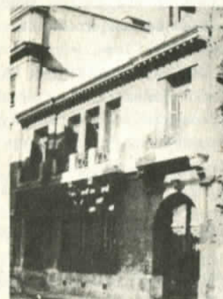
Londres 38: cárcel secreta para torturas