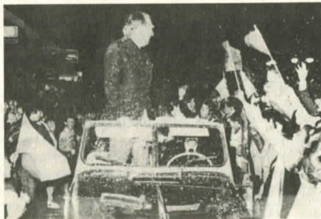
Presidente Sanguinetti: aclamado en Montevideo

al golpe militar del 27 de junio de 1973. Las dos semanas de huelga coagularon en torno a los trabajadores el repudio popular contra el régimen que arrasaba las instituciones y abría una zanja profunda. A un lado de ella el conjunto del pueblo trabajador, el Frente Amplio, las mayorías de los Partidos Nacional y Colorado, un conjunto de fuerzas sociales y una gran parte del clero, especialmente el de base. Al otro lado, la cúpula militar, los bancos y financieras ligados o copados por el capital financiero internacional, parte de los más grandes latifundistas y algunos empresarios del comercio importador-exportador. A la expectativa, apenas, quedó un sector de la burguesía industrial, comercial y agropecuaria que, por corto tiempo, alimentó la esperanza de beneficiarse de las migajas que pudiera dejar la gran oligarquía. Pronto advertirían también estos grupos que el golpe se había consumado sólo para enriquecer aun más a los que ya eran muy ricos, a caballo de una represión salvaje en nombre de la "doctrina de la seguridad nacional" y de una "economía abierta".