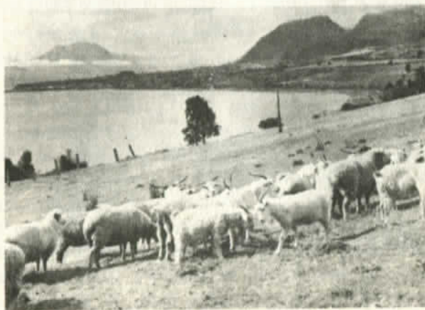
La Patagonia: ovejas en vez de indios

Volviendo al pasado, se estima que el primer europeo que tomó contacto con los onas de la región fue el célebre y temible pirata inglés -caballero de la reina- Francisco Drake. Eso ocurrió por allá por 1678. Mucho más tarde llegaron otras expediciones, entre las cuales, una de las más notables, la encabezó el capitán Fitz Roy. ¿Qué buscaban esos gringos ladrones? Nuevos suelos para los reinos europeos. El capitalismo naciente ya necesitaba de la expansión. Por eso las excursiones al territorio chileno eran cada vez más osadas y la situación, menos mal, movió al gobierno de Santiago con el propósito de incorporar, de una vez por todas, a la soberanía del país ese gran territorio magallánico. Fue el presidente Manuel Bulnes, que gobernó en el decenio 1841-1851 el que actuó con un criterio nacional y futurista. Punta Arenas quedó fundada el año 1849, primero, como una colonia penal. El inglés Enrique Reynard llevó desde las Islas Malvinas las primeras ovejas, las que se adaptaron sin problemas y se multiplicaron con generosidad. Los gobiernos de turno, con el correr de los años, fueron entregando las concesiones dentro de términos ventajosos. Políticos del momento, untados convenientemente, se transformaron en gestores. Hombres avispados e inescrupulosos supieron aquilatar ese negocio redondo que les ofrecía aquel mundo por conquistar. Así aparecieron los primeros pioneros, entre ellos José Menéndez y José Nogueira.