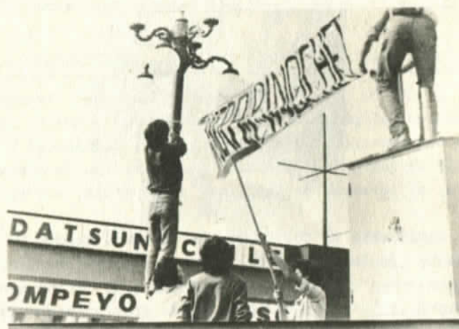
REUNION DEL CNT CON LOS EMPRESARIOS

ría o excluyente y se debe asumir que el destino del país será el resultado de un esfuerzo convergente de todas las fuerzas vivas que componen la nación. "Las metas centrales de esta mesa de concertación serán: recuperar la libertad y la democracia, restablecer el estado de derecho, reconstruir la economía nacional e impulsar el desarrollo integral del país con justicia y paz social".