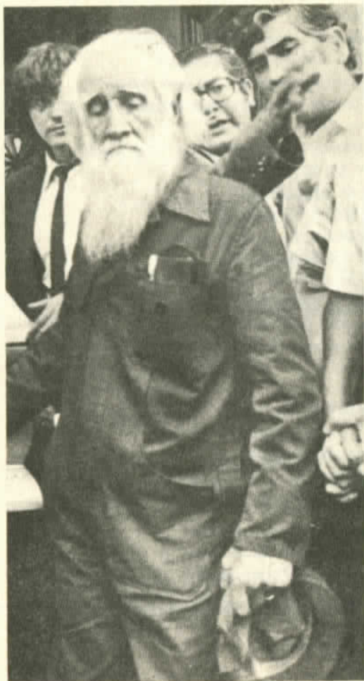
Clotario Blest, fundador de la CUT