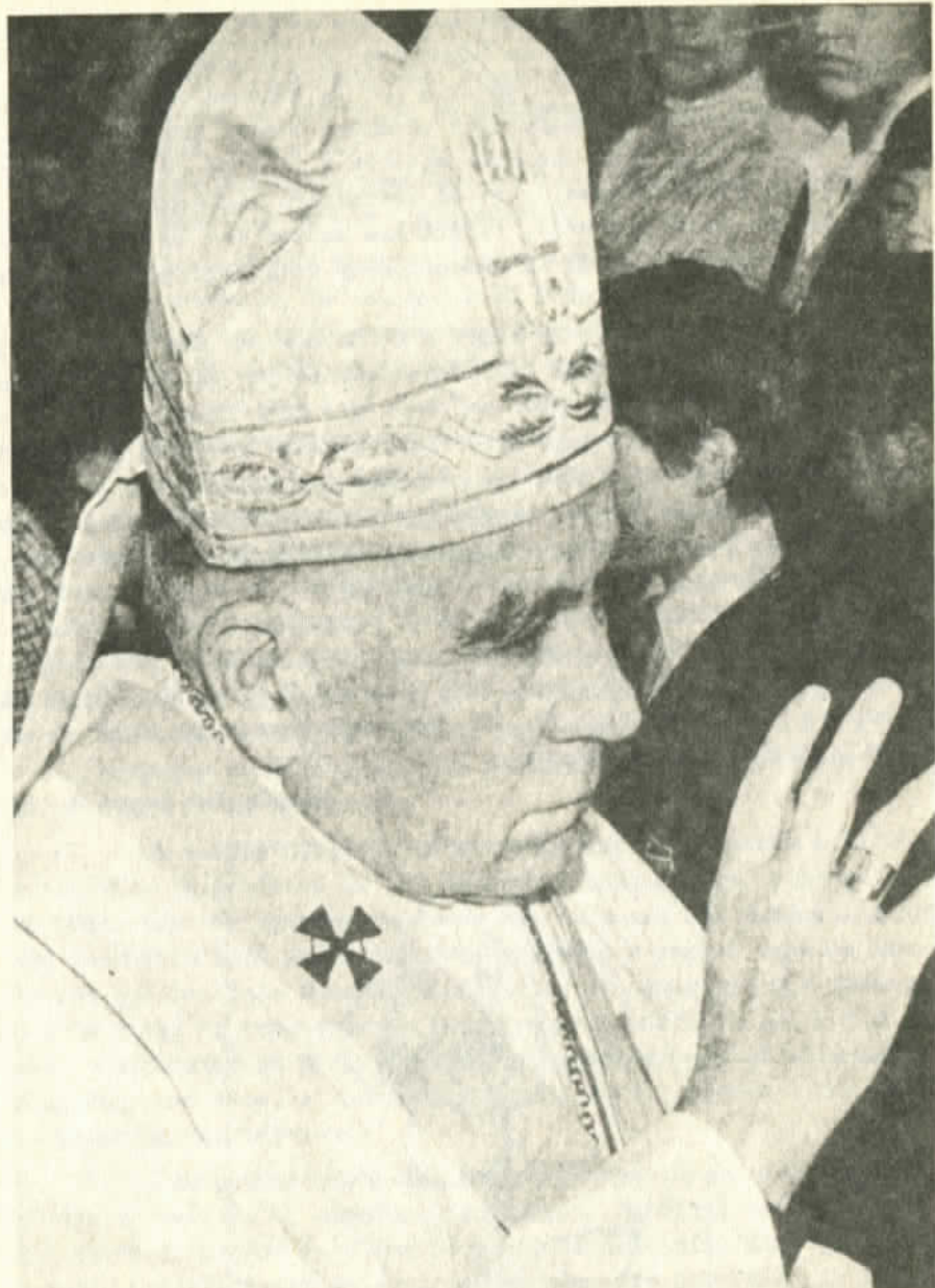
El Cardenal: gran figura de los católicos de Chile