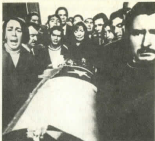
Funerales de Neruda