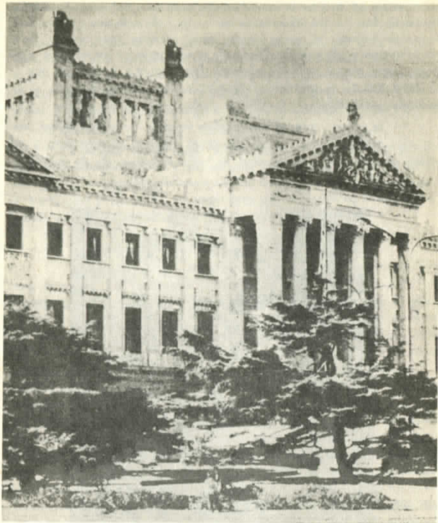
Parlamento uruguayo, ahora democrático