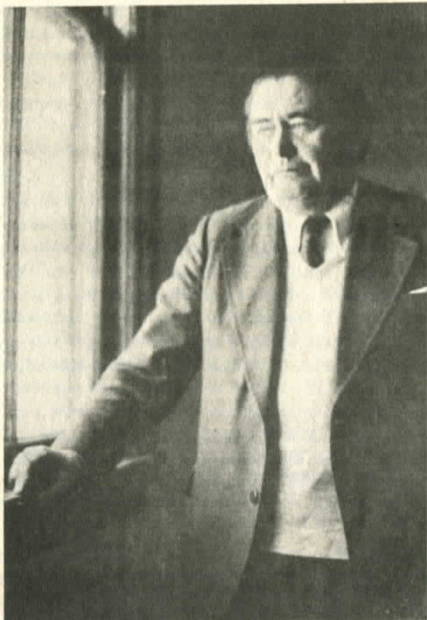
Tucapel Jiménez, mártir del movimiento sindical

espero que no seamos sonámbulos en la realidad nacional. Por eso queremos que la ANEP haga este sacrificio, no otro ahora, no mañana, para que las organizaciones sindicales asuman su responsabilidad histórica. Es un llamado amplio, sin poner coj tapisas a nadie para que suba en este carro unitario".