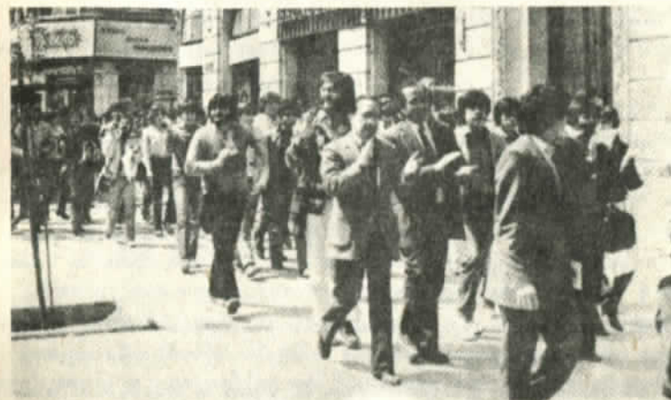
Los periodistas en un desfile callejero

La dictadura ha hecho su obra siniestra. La bolsa de los reporteros cesantes ha crecido. Las imprentas que servían a las mayorías, al pueblo, están arruinadas. Pero, además, incommovibles o más atrasadas, permanecen allí aquellas instituciones o empresas cuya rapacidad se ha duplicado. Y en Chile el consumismo -y su resultado inmediato, el egoísmo- se ha adueñado de esa minoría poderosa mientras que la hambruna, el desempleo y las necesidades corren para las mayorías. Hambruna de todo, de alimentos, de viviendas, de información, de conocimientos.