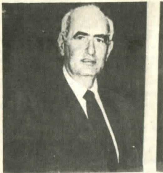
Agustín Edwards: amo de la prensa pinochetista

camente, para todos los campos de la vida: la economía, la ciencia, la cultura, el derecho de los seres humanos a participar de algo que nos compete a todos, la existencia y el futuro de nuestro mundo.