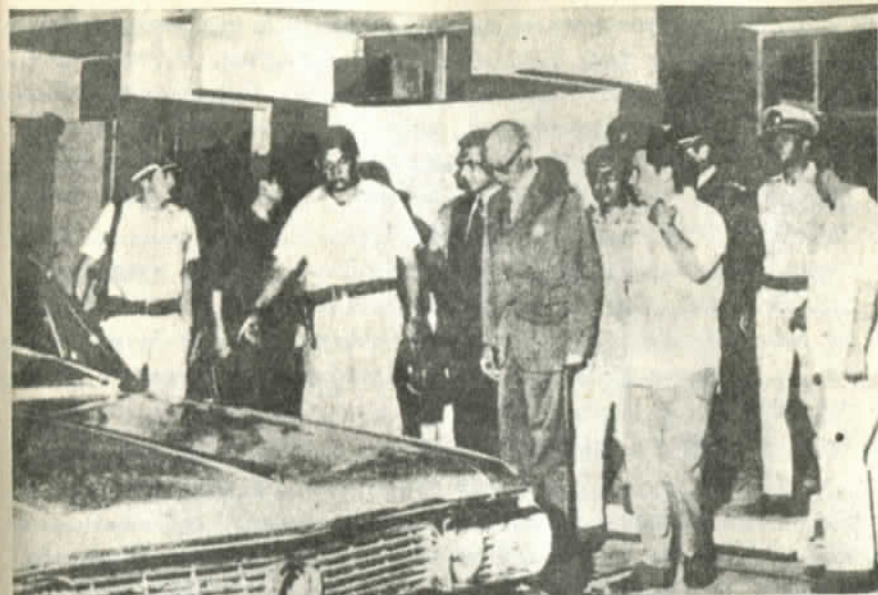
El último golpe contra el democrático Velasco Ibarra

Su triunfo reside más bien en la habilidad con que explotó la situación creada por la crisis, para en la más pura tradición del populismo criollo presentarse como el redentor de todos los males del país, prometiendo ilimitadas