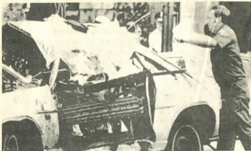
El auto de Letelier después del atentado