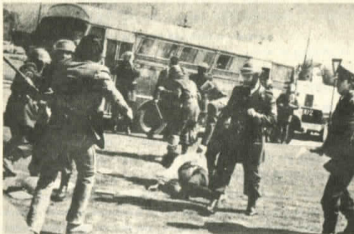
La brutalidad policial única respuesta

nato de los dos estudiantes perpetrado durante la octava protesta nacional y el enjuiciamiento de los culpables.