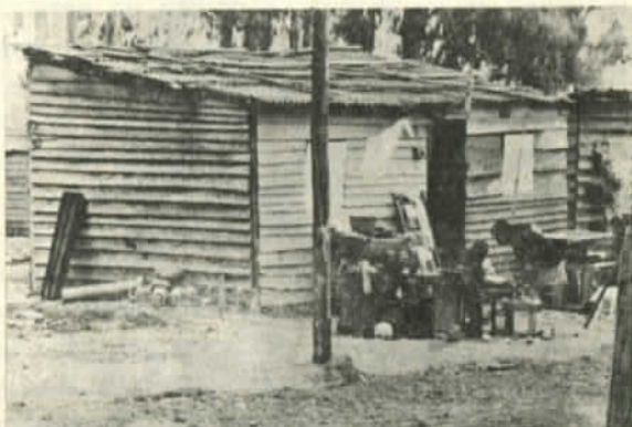
A las poblaciones sólo llega el consumo de la miseria

Esta anécdota ilustra el grado de corrupción que existe en la dictadura y es una advertencia a quienes creen que con conversaciones con la dictadura y sus hombres se puede llegar a la normalización del país.