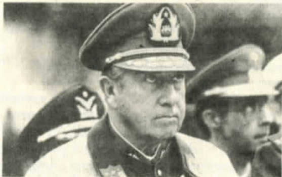
Pinochet : el cuidador de la cueva de Ali Babá.

mesa estaba dirigida a sus patrones, las fábricas de automóviles, a quienes les ofrecía un mercado de dos millones de autos. Es decir, estaba ofreciendo un objeto de consumo que no satisfacía las necesidades de nuestro pueblo, sino un consumo que favorecía la producción de automóviles. Lo que el pueblo necesitaba no fué ofrecido. En cambio, fue despojado de trabajo, de casas, de educación, de pan, de zapatos, de servicios médicos. Redujeron a los trabajadores a la condición de hambrientos aterrorizados por la CIA, la DINA, los servicios de seguridad de la marina... Los sicarios, en cambio, pueden satisfacer sus necesidades básicas y las recientemente aprendidas.