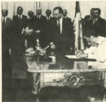
El nuevo gabinete ¿hasta cuando?

miento por parte del Estado de sus compromisos externos, es decir, garantizar el cumplimiento de la deuda externa y los de la renegociación de dicha deuda acordados por los "Chicago Boys", "dentro de los términos de referencia del FMI". Garantizó que se mantendría la política cambiaria y que se solucionaría cuanto antes la intervención de los bancos, retornándolos al sector privado. Hasta aquí no existe ningún cambio de la política implementada por los equipos anteriores. Lo único nuevo fue el ofrecimiento de destinar mayores recursos a OD, PP y viviendas, en base a la rediscusión de algunos aspectos de los dictados del FMI -no muchos como veremos más adelante- y el logro de nuevos créditos de organizaciones financieras controladas por el gobierno de los EE.UU.