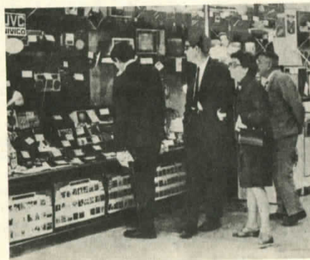
Vitrinas llenas y solo mirones

políticas. Los valores consumistas del modelo económico del fascismo los han trastornado un poco. Sólo los jóvenes maduros políticamente no están interesados en el uso de blue jeans norteamericanos, camisas malboro, zapatillas adidas. Los jóvenes antimodelos son llamados "artesanales" porque sus tenidas carecen de pretensiones yanquis. Me llamó la atención la falta de inquietudes ideológicas o culturales de la actual generación. No hay jóvenes en las exposiciones ni en los conciertos de música sinfónica; no son consumidores de libros ni siquiera en la biblioteca nacional. Sólo los conmueve un poco la nueva canción, la trova cubana, Silvio Rodríguez, tal vez Víctor Jara o Violeta Parra. Los jóvenes pequeño burgueses están siempre interesados en la música pop o en conseguir dinero para ir a bailar a un disco. Para los jóvenes de la clase obrera no hay nada, ni campos de deportes ni salones de baile que no sean los de algunas parroquias en las poblaciones. Así resulta aterrador el consumo de drogas y de alcohol. Para desgracia del pueblo chileno el vino es barato y la comida cara. Los muchachos se drogan y beben. Fumar "pitos" es un hábito generalizado y lo practican hasta jóvenes muy lúcidos. Es una juventud desorientada por el sistema pero indiscutiblemente rebelde.