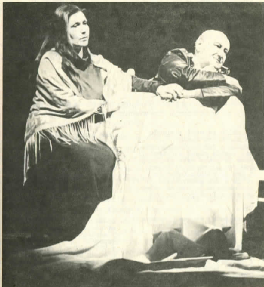
Una escena de "Fulgor y Muerte de Pablo Neruda" en la versión del Volktheater de Rostock.