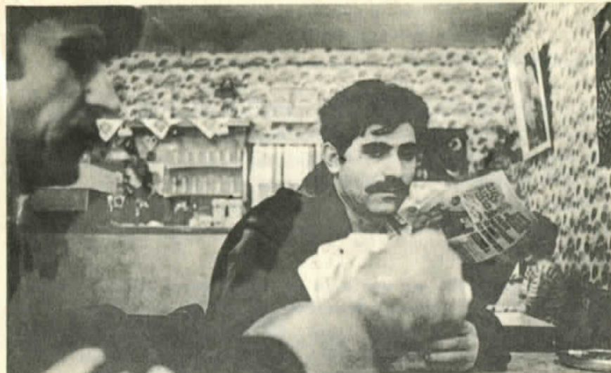
La mayoría de los exilados viven duramente y no son apolíticos

En Chile, en Sudáfrica o en cualquier país al estilo Paraguay, los apolíticos se alinean, qué duda cabe, a la sombra del poder. Siempre colaborando de hecho, o con su silencio. Siempre bajando la cabeza, aprovechándose, cerriles y serviles. Predicando el orden y buena conducta. Siempre con los aomos. A veces hasta con argumentos sobrenaturales.