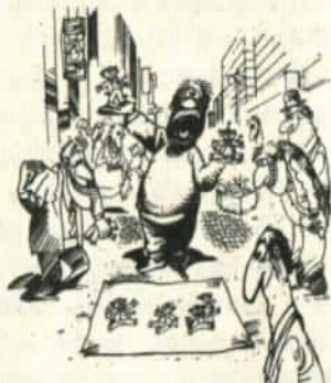
—¡Llévele oiga, Friedman el muñequito para pinchar, útil y divertido, la novedá, sacar a cien...!

No debemos olvidar que quien con su presencia mancilla la historia de Chile, es un producto refinado de la más abyecta de todas las instituciones de los EE.UU.: la CIA, la cual conociendo la estructura arribista pequeño-burguesa de Pinochet, su triste sed de reconocimiento social y su complejo de inferioridad frente a la así llamada "aristocracia chilena", lo ha elevado a la categoría de señor ... pero en el rol de "boss mafioso". Todo "boss" tiene una cierta estructura de personalidad que es característica, un precio que oscila dentro de amplios márgenes y un sistema de valores básicos compatibles con el rol que la CIA exige. El terrorismo que Pinochet y sus amigos practican en gran escala es el estilo político que el gobierno de EE.UU. utiliza tanto a nivel nacional como internacional.