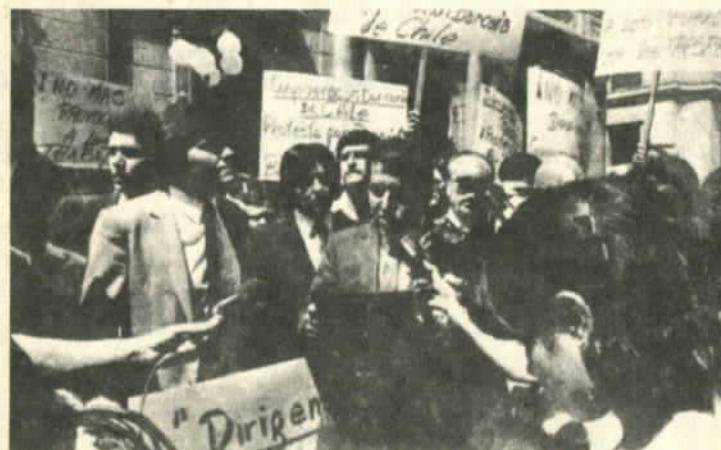
Bancarios protestan en la calle

caro debido, principalmente, a los gastos armamentistas del gobierno de Reagan.