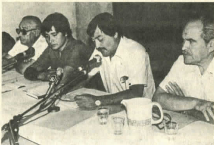
El comando nacional de trabajadores mantiene su unidad

mativos. Señaló que bajo el régimen militar, especialmente, los periodistas han "sido afectados por la falta de libertad de prensa".