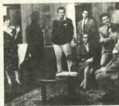
La "gente linda" del Santiago elegante

por el hambre prostituyen a sus niñas de 11 o 12 años. Una de ellas dijo "tengo seis más que alimentar y no queda más remedio que prostituir a una para que traiga la comida de las demás." La pobreza es criminal. Pero tiene fronteras delimitadas. Se siente horriblemente en las poblaciones marginales, en barrios como Santa Rosa, Quinta Normal, Conchalí. No se advierte en el barrio alto donde la gente vive como en los países más ricos y desarrollados. En Chile vive todavía mucha gente que lo pasa bien y que no son sólo de las castas oligárquicas. Hay sectores profesionales, comerciantes, especuladores financieros que lu- cen espléndidos automóviles, tenidas de última moda y que se di- vierten en boites exclusivas, en balnearios dignos de la costa azul, en restaurantes caros, en canchas de tennis, de golf. Son la llamada "gente linda" que hasta tiene un lenguaje especial, que luce una frivolidad tan grande como su desprecio al pueblo y que apoyan todavía a la dictadura en algunos casos.