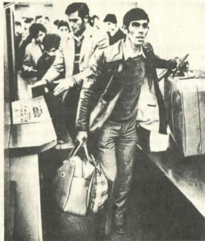
Conocida foto que se identifica con el viaje hacia el exilio. Algunos no regresaran