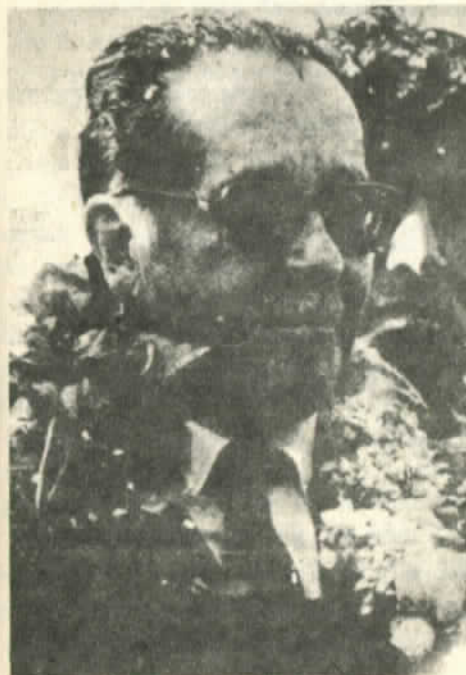
Presidente Hernán Siles Suazo

Bolivia atraviesa un período muy duro. Mucho depende de la capacidad de la izquierda para preservar y estrechar la unidad de sus filas y cooperar con distintos sectores de la población rural y urbana. Pese a la grave crisis social y económica y la precaria situación material, los trabajadores bolivianos están determinados a salvaguardar el proceso de transformaciones democráticas y defender al Gobierno de la UDP contra los ataques del imperialismo yanqui y la reacción doméstica.