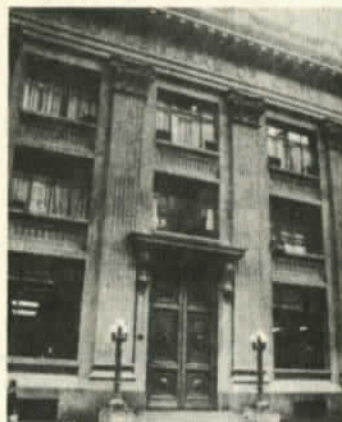
El Banco Central de Chile: hasta el edificio tendría que incluirse en el pago de deudas.

2.- Deudas por créditos hipotecarios: Las deudas por dividendos de bienes raíces no pagados se reducen al 60 % (los cuales habrá que pagar ahora) y el resto una vez que se termine de pagar los dividendos normales con recargo. Se trata de una situación parecida a la anterior, los sectores afectados por la política económica, en cesación de pagos, no han modificado la situación que los llevó a la morosidad, por lo tanto no es un problema de facilidades para enfrentar las deudas de arrastre. A esto se agrega el hecho que en las deudas hipotecarias benefician de igual manera a