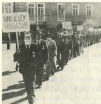
Periodistas de Valparaíso en un desfile contra la ley mordaza.

La "nueva ley" de prensa tiene como objetivo frenar la ola de denuncias que se están haciendo sobre los escándalos en que están envueltos los más altos personeros del régimen.