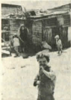
Así viven miles familias de trabajadores mientras el General continua construyendo mansiones para él y su parentela.

A la plantación de almendros y nogales se han sumado otros árboles en correcta formación, que emulan al destacamento de boinas negras que cada mañana se alinea bajo los balcones del Capitán General.