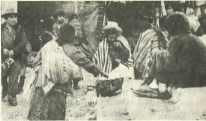
Victimas del FMI

taria sin consultar al "Fondo". Más adelante señalan estos parlamentarios que "el FMI ya no es más un organismo internacional de cooperación financiera, sino un instrumento subversivo que, con sus recetas económicas, trata de aplastar el crecimiento de los pueblos en vías de desarrollo" ¿Es que alguna vez fue otra cosa? ¿Por qué "ya no es"? Si la historia de sus correrías no comienza en el mes de abril del 84 en República Dominicana. Es mucho más vieja y no ilustra, precisamente, la idea de "cooperación". Luego de 40 años de existencia de esos instrumentos , como el BIRD y el FMI -y no "opresor principal"- la dependencia y el subdesarrollo en nuestros países, no ha disminuído ni un solo punto, sino que, por el contrario, se ha fortalecido ¿Cooperación? ¿Cómo se explica que estando formado por más de 140 países, sea la banca norteamericana la que decida en forma casi exclusiva las políticas del FMI? Curioso organismo de cooperación internacional aquel en que 1 decide y 140 acatan.