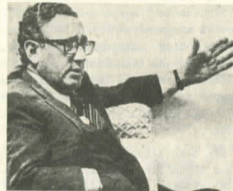
Kissinger, una de las criaturas del FMI

Como se ve el "tratamiento" fue un éxito, no para Jamaica, que en 1980 tenía una deuda externa que alcanzaba ya a los 900 millones de dólares -1971 era de 142,9 millones- sino para los monopolios que volvieron a funcionar libres de toda "amenaza" bajo el gobierno pro-yanqui de Seaga, el que a su vez tres años más tarde, en forma agradecida, se prestaba a que Jamaica participara en la farsa que montó el gobierno de Reagan para agredir brutalmente a la pequeña isla de Granada.