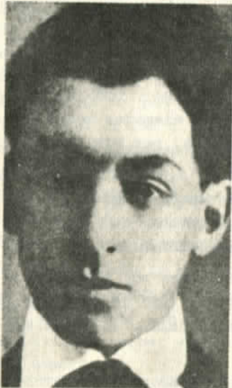
Neruda a los 15 años.

En esta casa de los Masson había también un salón al que no nos dejaban entrar a los chicos sino en contadas ocasiones. Nunca supe el verdadero color de los muebles, porque estuvieron cubiertos con fundas blancas hasta que se los llevó un incendio. Había allí un album con fotografías de la familia. Estas fotos eran más finas y más delicadas que las terribles ampliaciones iluminadas que invadieron después la frontera.