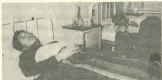
Los huelguistas en el hospital regional de Rancagua después de 27 días sin comer