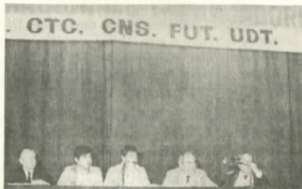
El CNT, motor de grandes acciones

ducción indicados por el régimen militar no tienen nada que ver con la realidad y que con los actuales resultados no se llega incluso al afea sembrada en el año agrícola 1959-1960. En este año fueron sembradas un millón 442.540 hectáreas y según cifras de la Sociedad Nacional de Agricultura en el año 1983-1984 han sido sembradas un millón 300 mil hectáreas.