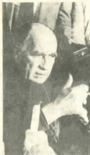
El Cardenal llama a la unidad

pués que la entidad laboral introdujo modificaciones en su estructura con la incorporación de otras organizaciones sindicales.