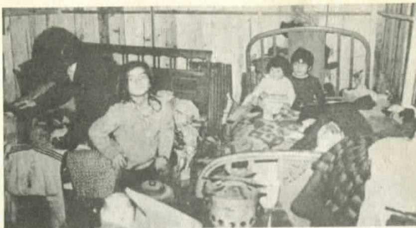
Improvisados refugios para los damnificados

complejo maderero Los Libertadores y sepultó a los trabajadores y sus familias. Resultado: doce muertos ahogados y sepultados en el lodo. Fue difícil después rescatar los cadáveres. Lo mismo ocurrió con el embalse "La Paloma" cuyas compuertas se abrieron y cayeron sobre Limarí un pueblo prácticamente sepultado bajo las aguas. Toda la costanera de Valparaíso y Viña del Mar fue azotada por las olas más embravecidas que hayan conocido los porteños. Se derrumbaron muelles, se perdió el cargamento de barcos enteros, volaron bodegas completas de alimentos.