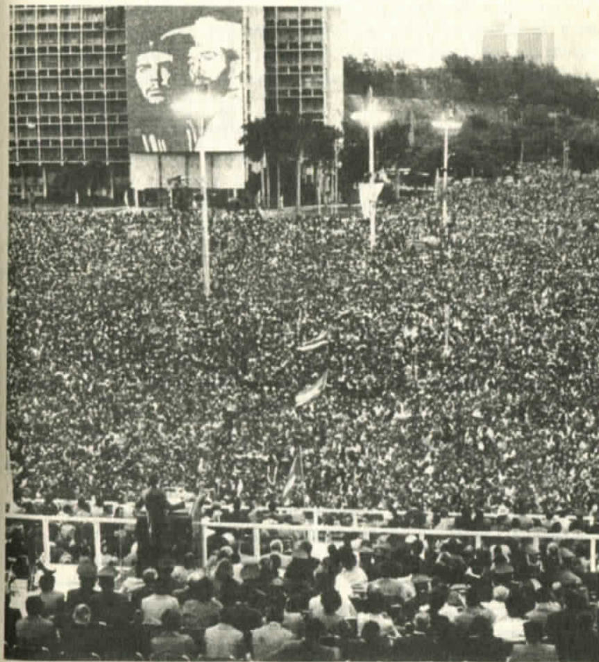
Mitin en Cuba, país sin deudas con el FMI