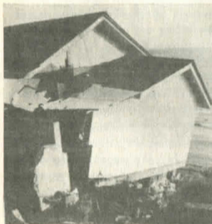
La furia de los temporales arrancó viviendas

Así la dramática realidad que la dictadura trata de ocultar pasó a primer plano y figuró obligatoriamente en los programas informativos de la televisión, en las páginas de los diarios juntistas, en estremecedores relatos radiales.