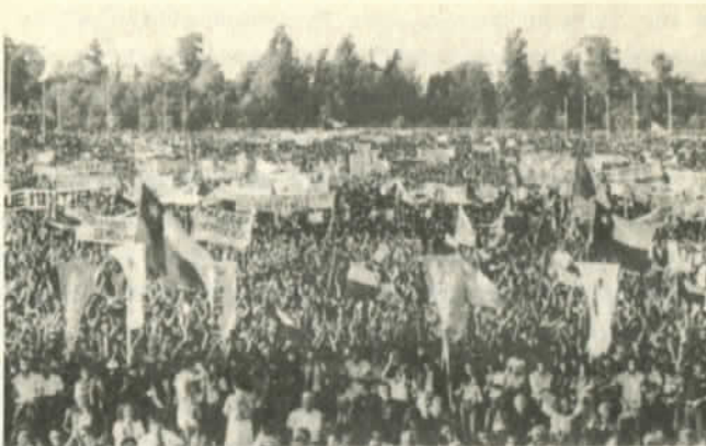
Mitin unitario y sin divisiones ideológicas