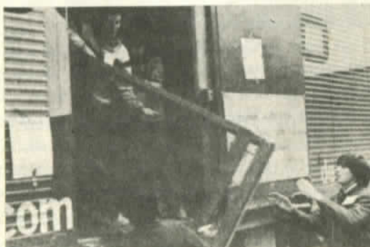
Lo mejor: la solidaridad popular