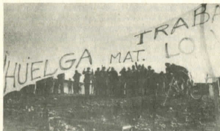
Valerosa huelga en Lo Valledor

alzas de los artículos de primera necesidad como el azúcar, el aceite, la locomoción y el agua y remarcó que la cesantía sigue siendo un flagelo incosado por el régimen militar.