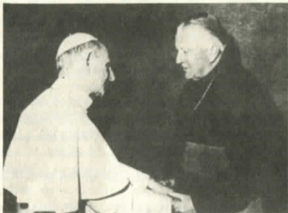
Paulo VI y el Obispo Fresno

- ¿Cómo reacciona un sacerdote frente a un caso como el de El Melocotón?