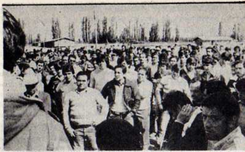
Los protagonistas de la huelga de Colbún-Machicura

ANEF estudia demanda ante la OIT. - La Agrupación Nacional de Empleados Fiscales, ANEF, dijo que estudia la posibilidad de recurrir en demanda de amparo de la OIT por la prohibición que pesa sobre los médicos de otorgar licencias superiores a cinco días a los empleados de la Administración Pública.