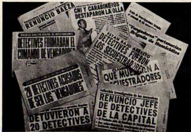
"NIEGUEN ESAS COSAS"