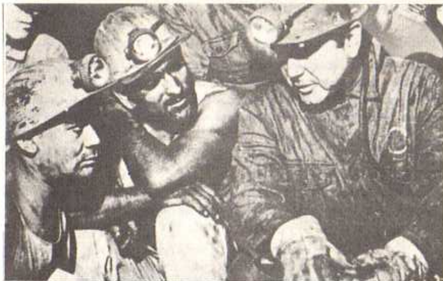
TRABAJADORES DEL COBRE

En síntesis, hoy se dan indicios más favorables a la perspectiva del desarrollo de la unidad y la lucha de los trabajadores chilenos por sus derechos. También se dan claras señales de que la tiranía intentará frenarla recurriendo a cualquier método represivo, "legal o ilegal", y que, como siempre, contará con la complicidad de la "justicia". Todo ello debe movernos a redoblar nuestros esfuerzos en el trabajo de denuncia de la dictadura y de recabar la solidaridad internacionalista con la lucha de los trabajadores en nuestra patria.