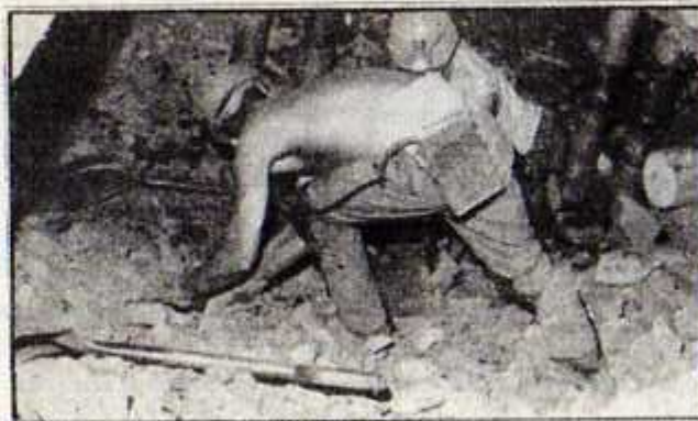
MINEROS DEL CARBÓN

por este problema y por la ley 18 134, cuya derogación exigieron perentoriamente el Consejo Regional del Carbón y la Federación Minera.