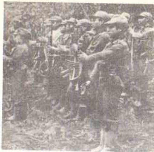
Guerrilleros guatemaltecos en El Quiché

Según el periodista alemán, Friedrich Kaseebeer, corresponsal del "Süddeutscher Zeitung" de la RFA el gobierno de los generales en Guatemala no es otra cosa que "una mafia criminal". El mismo periodista escribe "Los crímenes políticos son para el gobierno de Guatemala un deporte nacional". Según datos del Ejército Guerrillero de los pobres, las víctimas de crímenes fueron en 1981 unas 13.500 personas. En su mayoría se trata de estudiantes universitarios, intelectuales, profesionales, campesinos, indígenas. Fueron asesinados 75 activistas del Partido Demócrata Cristiano al comienzo del año. Cuando en Ciudad de Guatemala se llama a alguien "sandía" es