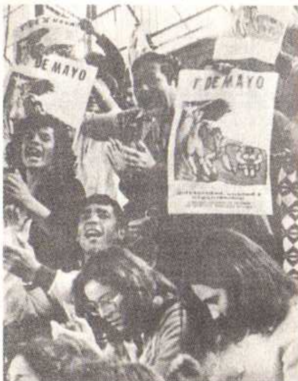
Primer de Mayo en Santiago